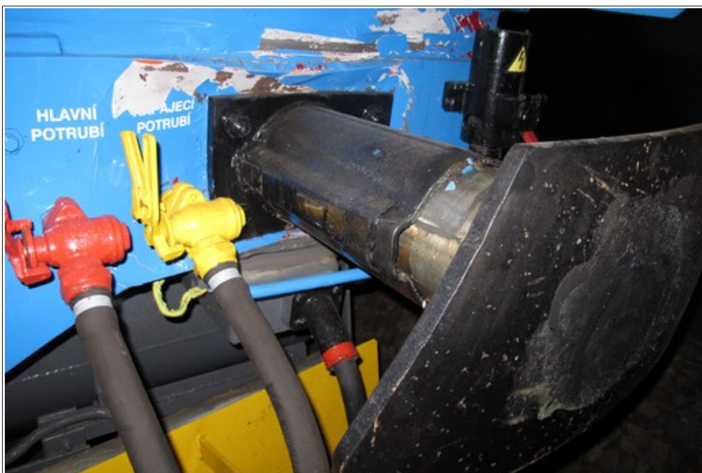
Obr. č. 3: Pohled na deformovaný čelník a nárazecí ústrojí HDV 372.006-7 po vzniku MU.