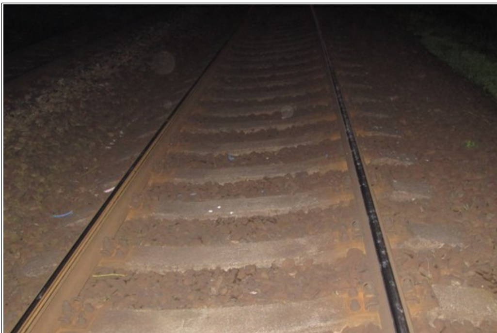
Obr. č. 2: Pohled na místo vzniku MU s viditelnými stopami laku, odpadlého z HDV vlaku Lv 43398 při srážce s vlakem Pn 48378.