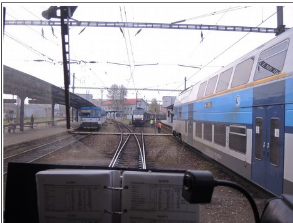
Obr. č. 4: Pohled ze stanoviště strojvedoucího HDV vlaku Os 9770 na vlak Nex 41363 v konečném postavení po MU. Vlaky od sebe zastavily ve vzájemné vzdálenosti 50 m mezi předními čely vedoucích HDV.