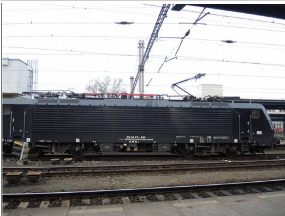
Obr. č. 5: HDV vlaku Nex 41363 v konečném postavení po MU, tzn. 16 m za hlavním (cestovým) návestidlem Sc7 (km 437,315).