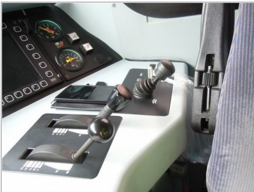
Obr. č. 3: Ovládací páky jízdního a brzdového kontroléru na stanovišti strojvedoucího 2 HDV 189.844-4 v poloze po zastavení vlaku Nex 41363 po MU.

Z analýzy brzdného výkonu při brzdění vlaku Nex 41363 v žst. Kralupy nad Vltavou bezprostředně před a v době vzniku MU vyplývá, že strojvedoucí použil brzdný výkon vyjádřený brzdným zpomalením 1,43 \text{ m}\cdot\text{s}^{-2} . Ten byl výrazně vyšší než minimální předepsaný brzdný výkon pro vlak brzděný v režimu brzdění „P“, se skutečnou výměrou brzdících % 87, stanovený ČSN EN 14531-1 a vyhláškou UIC 544-1 vyjádřený brzdným zpomalením 0,79 \text{ m}\cdot\text{s}^{-2} . Strojvedoucím použitý brzdný výkon odpovídal intenzitě brzdění při použití rychločinného brzdění.