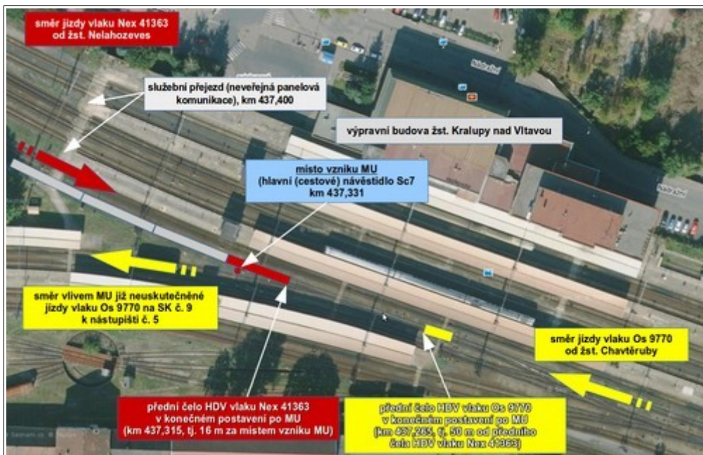
Obr. č. 2: Schéma místa vzniku MU.