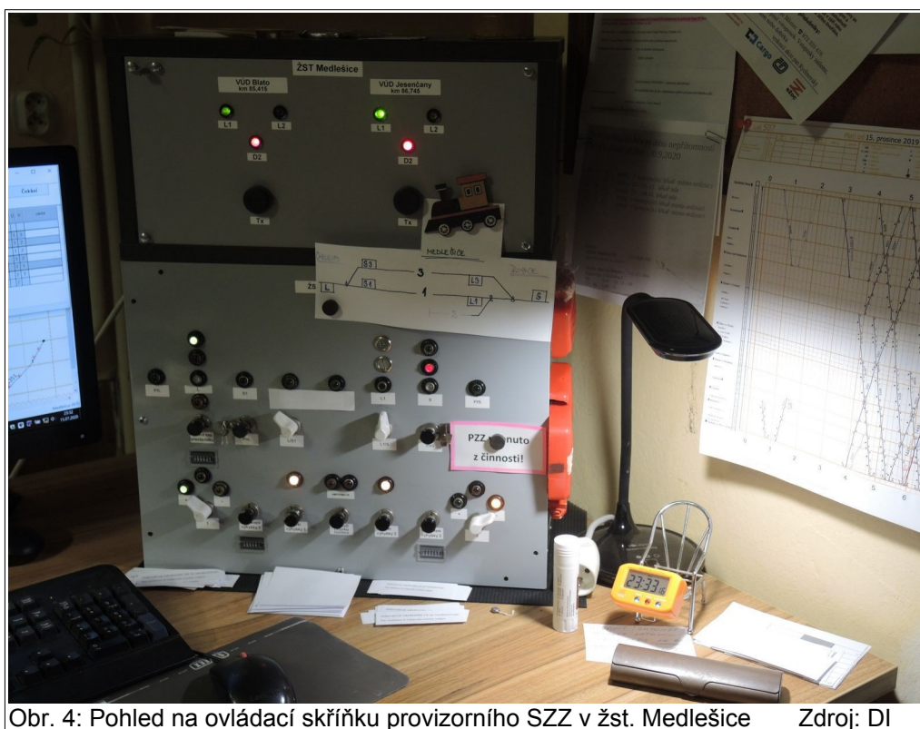
Obr. 4: Pohled na ovládací skříňku provizorního SZZ v žst. Medlešice

Je zřejmé, že výpravčí nejednal s úmyslem vzniku MU. Jeho chování bylo ovlivněné nevědomou chybou – nepozorností při řízení drážní dopravy a obsluze SZZ, kdy vlivem konání výluky SZZ žst. Medlešice nebyly v činnosti technické prostředky zabezpečení, jež by při pochybení (omylu nebo selhání) výpravčího zabránily nedovolenému přestavení výhybky č. 1 v době, kdy byla obsazena vlakem Os 5338.