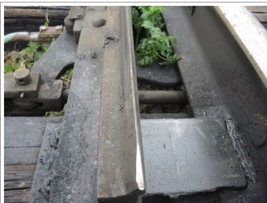
Obr. č. 2: Pohled na naražený hrot pravého jazyka výhybky č.1