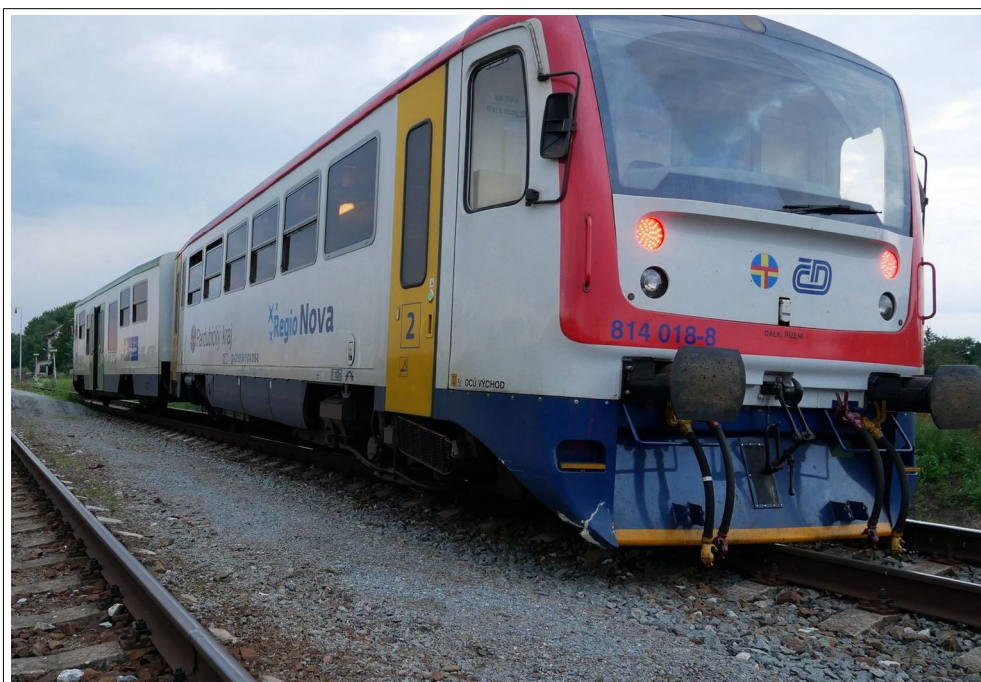
Obr. 5: Pohled na vykolejené DV