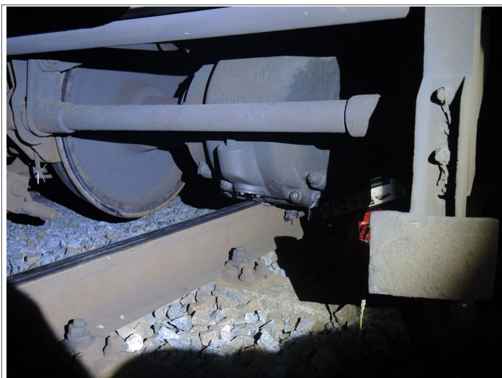
Obr. 6: Pohled na vykolejenou a poškozenou nápravu HDV