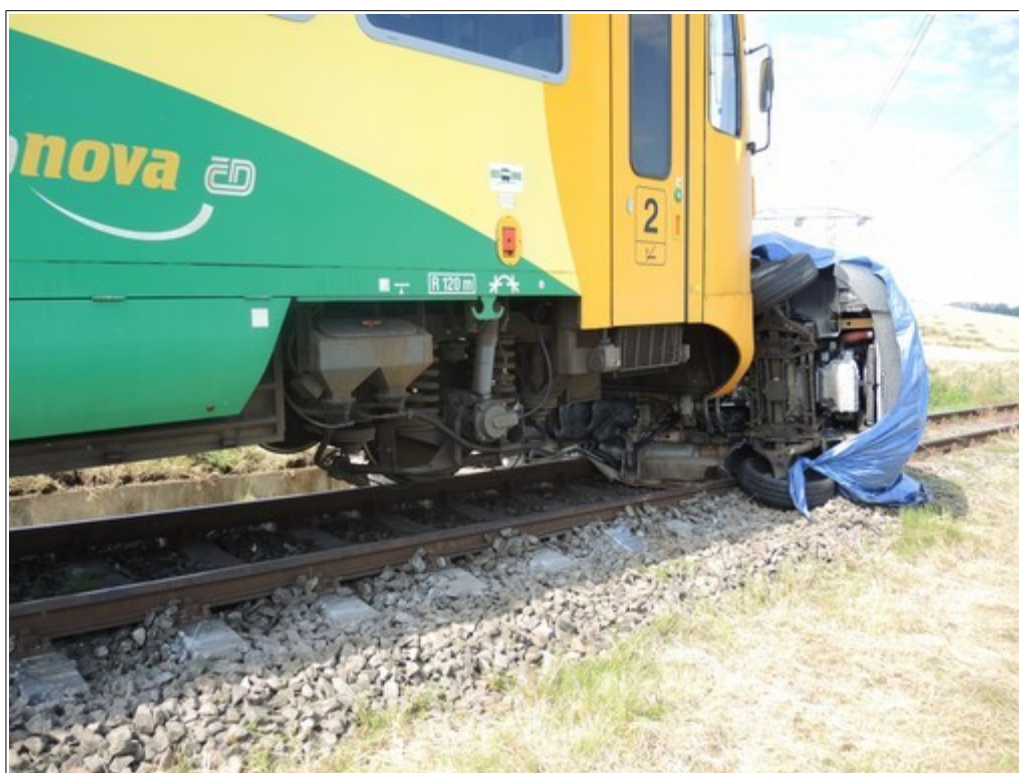
Obr. č. 6: Vykolejená (nadzvednutá) první náprava HDV