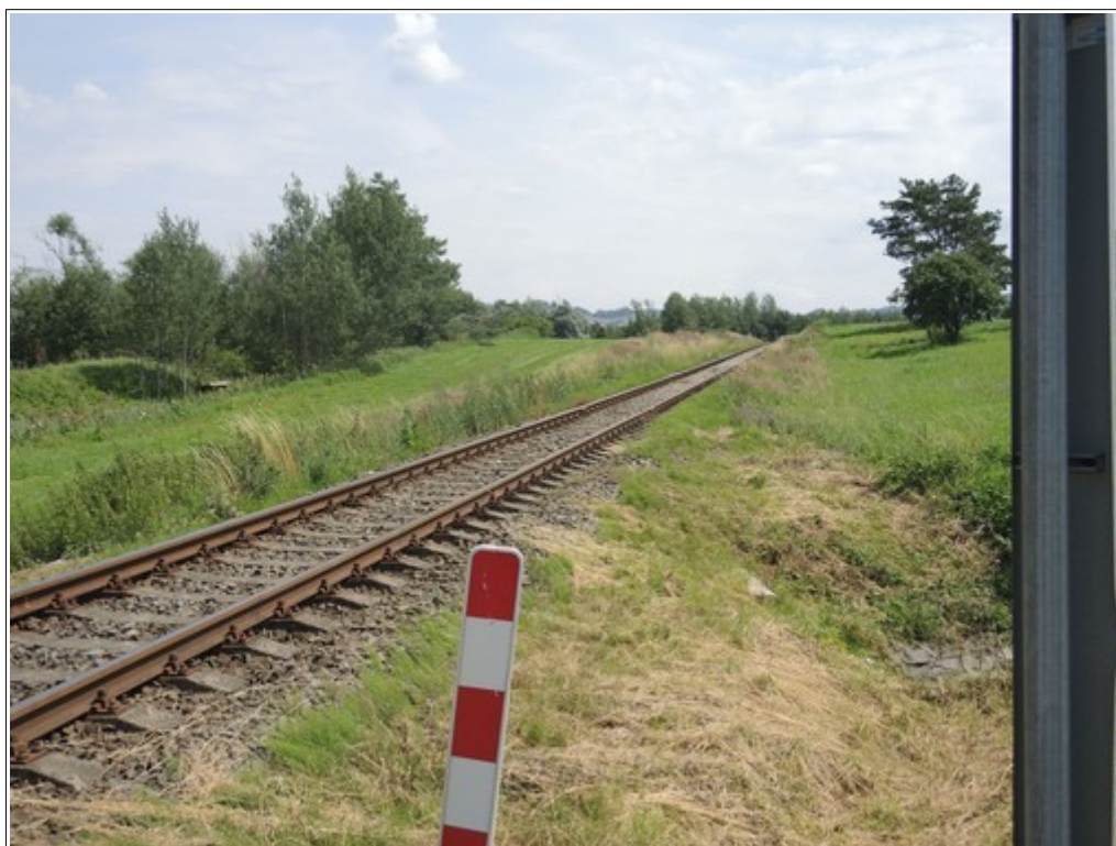
Obr. č. 5: Výhled řidiče od výstražného kříže ve směru příjezdu vlaku