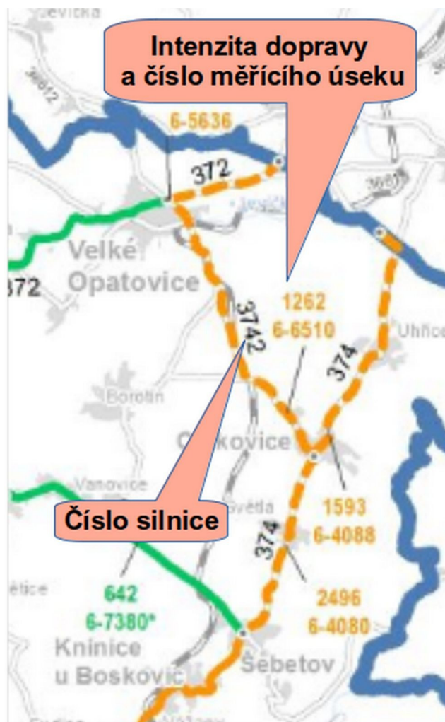
Obr. č. 3: Intenzity dopravy z celostátního měření v roce 2016

Dopravní moment se dle DI z údajů uvedených v evidenčním listu přejezdu a z výsledků měření ŘSD na úseku 6-6510 (Cetkovice – Velké Opatovice, viz Obr. č. 3) vypočítá následujícím způsobem dle TP 189 a ČSN 73 6380: