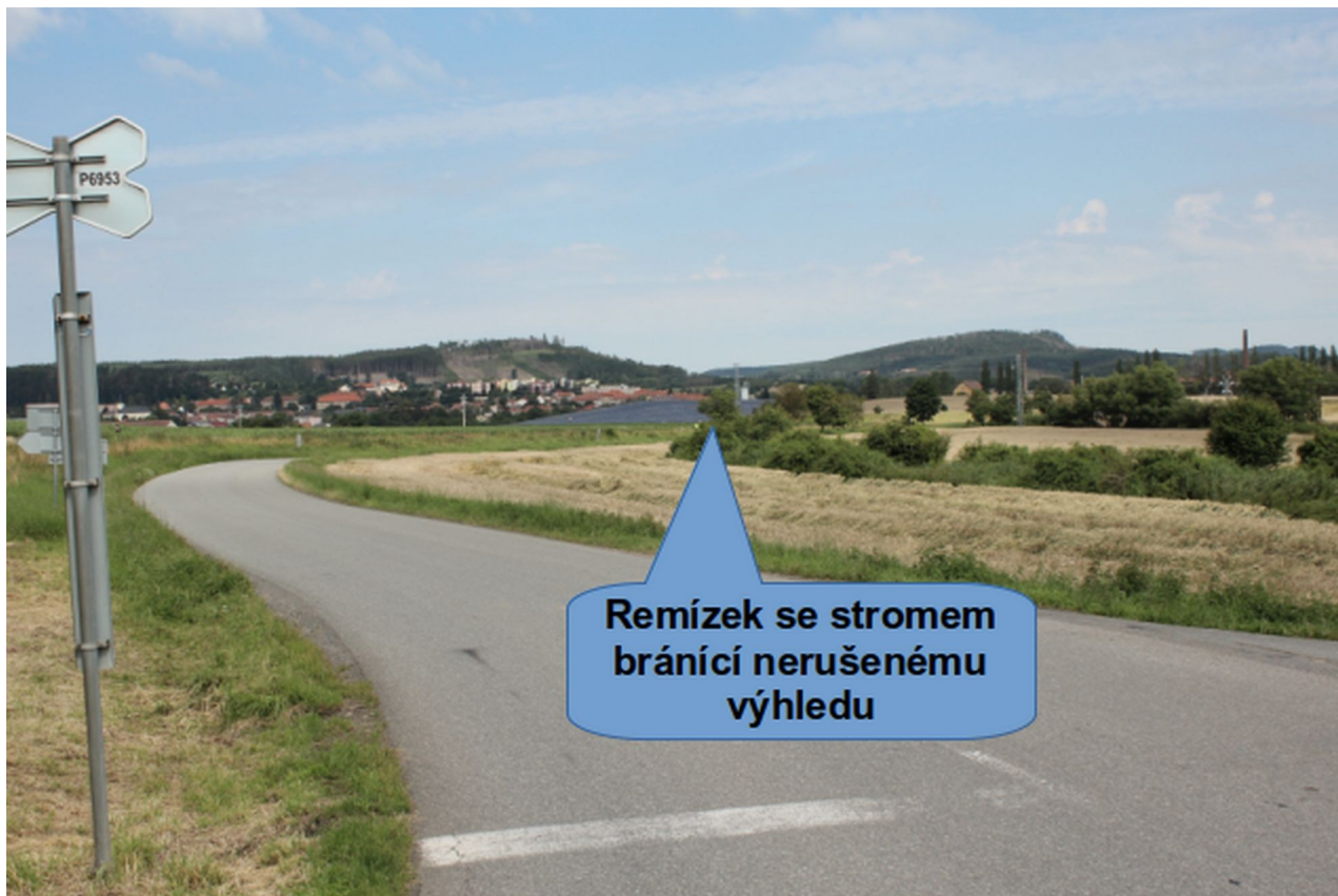
Obr. č. 4: Rozhledová délka L_p pro rychlost 50 km.h -1 proti směru jízdy vlaku s remízkiem a stromem, který tvořil překážku ve výhledu na trať

Rozhledové délky pro nejpomalejší silniční vozidlo L_p stanovené SŽ ve všech 4 kvadrantech neodpovídaly reálně naměřenému parametru D_p = 11 m, který zjistila DI. Umístění výstražného kolíku s návěstí „Pískejte“ ve směru jízdy od žst. Velké Opatovice na vzdálenost 313 m bylo rovněž v rozporu s výpočty a měřením DI. Zjištěné nedostatky jsou mimo příčinnou souvislost.