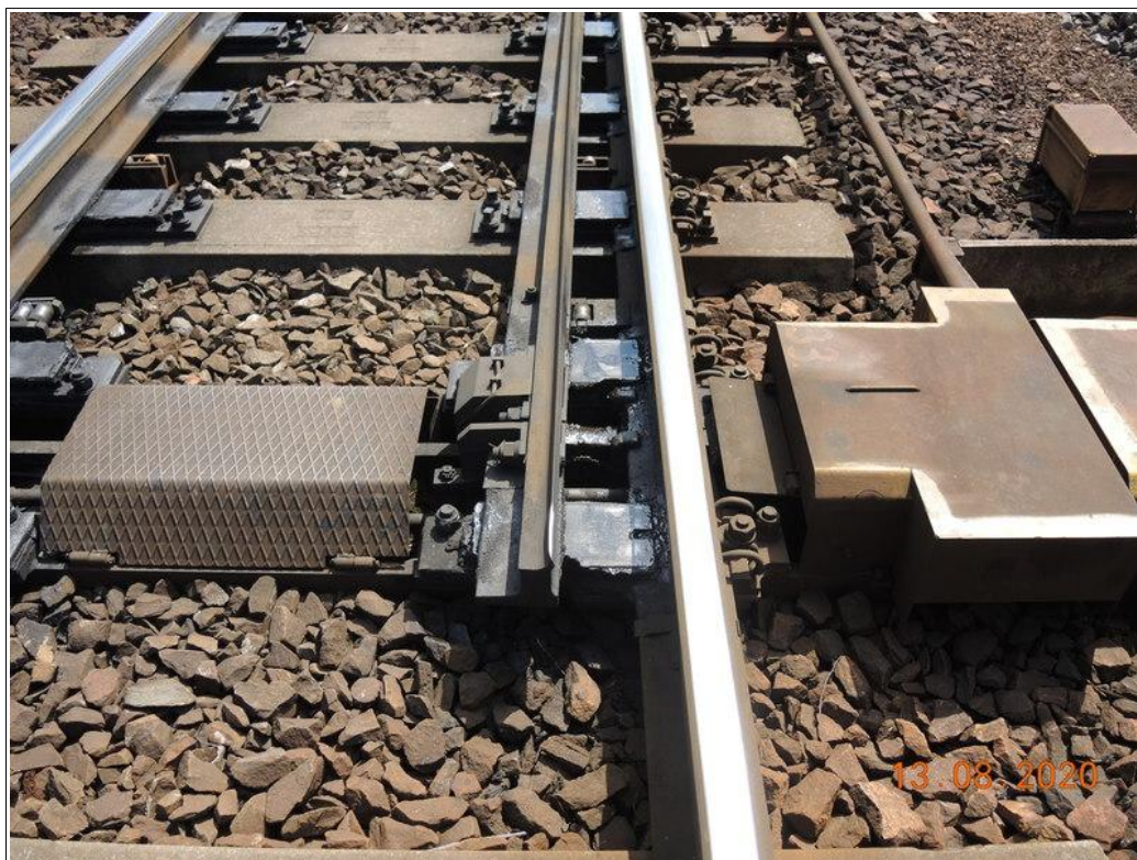
Obr. č. 6: Pravý přímý jazyk výhybky č. 33 žst. Tišnov se stopou otěru pravého předního kola předního podvozku „a“ TDV 51 54 82-40 401-6.