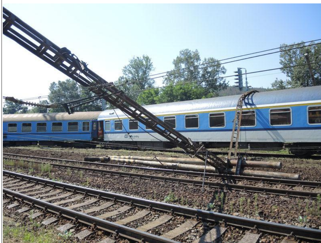
Obr. č. 3: Následkem MU poškozená nosná brána TV mezi TP č. 31 a 31A a obě vykolejená TDV vlaku R 975 (pohled od SK č. 2).