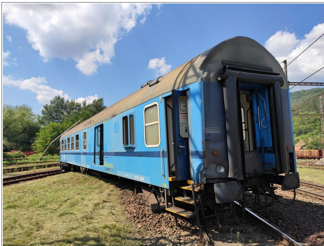
Obr. č. 4: Vykolejené TDV 51 54 82-40 401-6, řazené jako 5. TDV za HDV vlaku R 975, v konečném postavení po MU v prostoru SK č. 1 a č. 3.