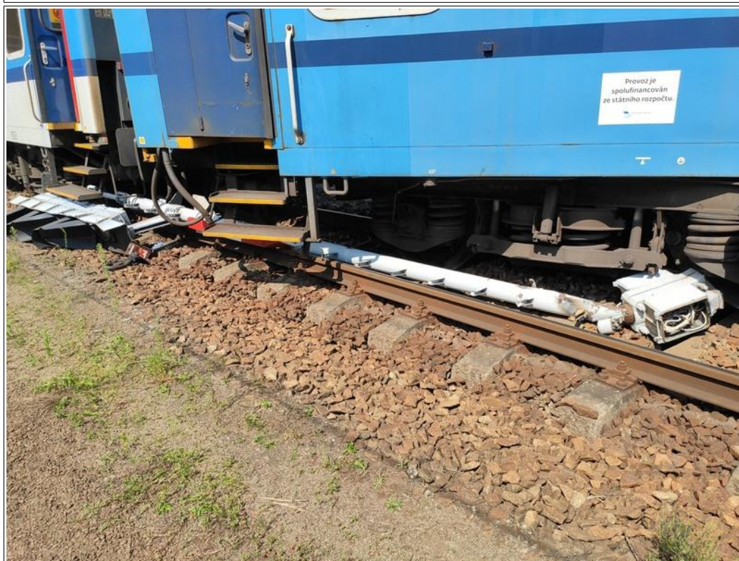
Obr. č. 5: Zničené odjezdové návěstidlo L3 žst. Tišnov se po MU nacházelo pod zadní částí 5. TDV a přední částí 6. TDV vlaku R 975.