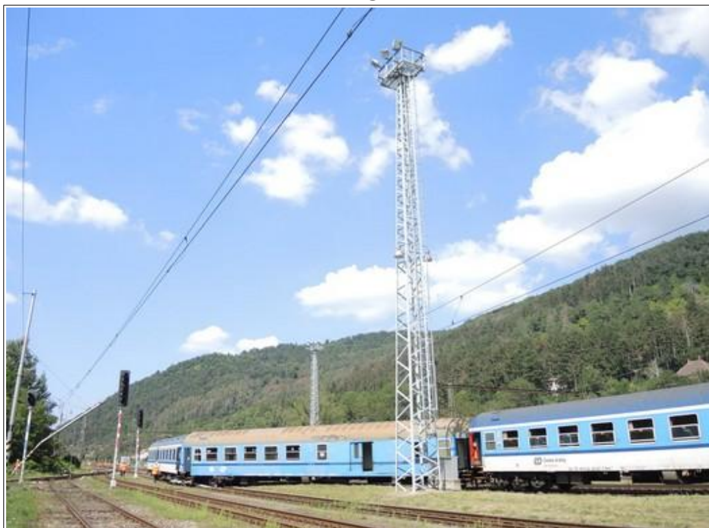
Obr. č. 2: Snímek 2 vykolejených TDV, řazených na konci vlaku R 975 (pohled od SK č. 5, v popředí osvětlovací věž OV 7).