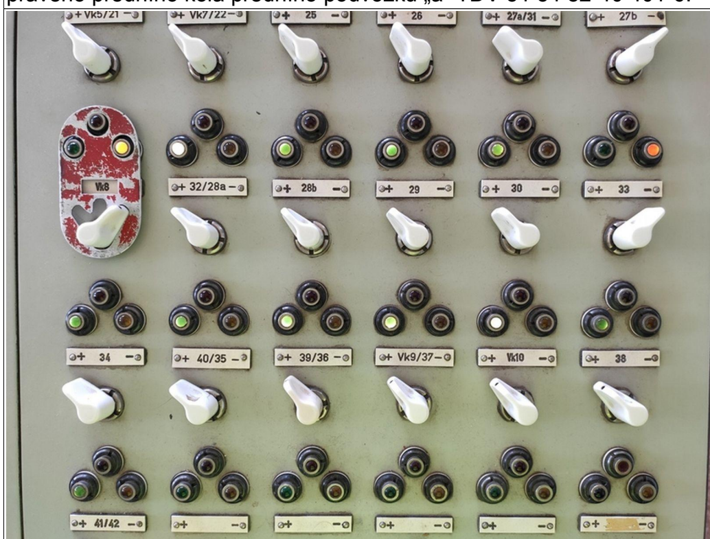
Obr. č. 7: Snímek části ovládacího stolu SZZ žst. Tišnov po MU, dokládající mj. třípolohový radič výhybky č. 33 přeložený do polohy „-“.