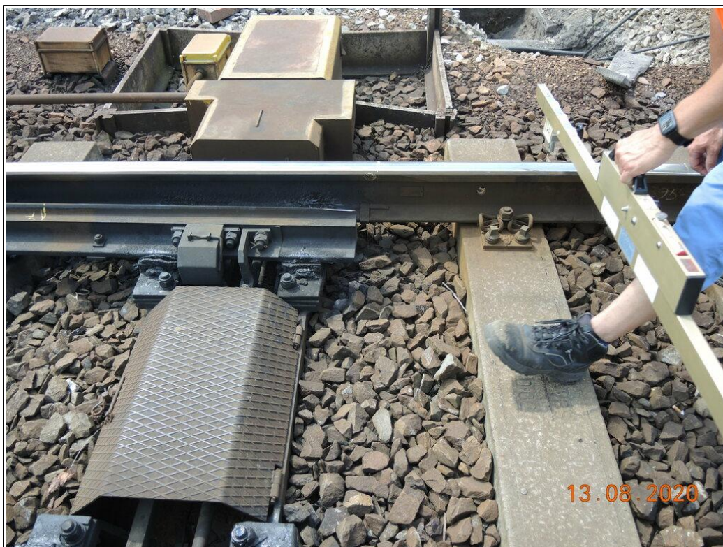
Obr. č. 8: Snímek pořízený dne 13. 8. 2020 ve 13:21:40 h ve výhybce č.33 žst. Tišnov při měření železničního svršku po MU.