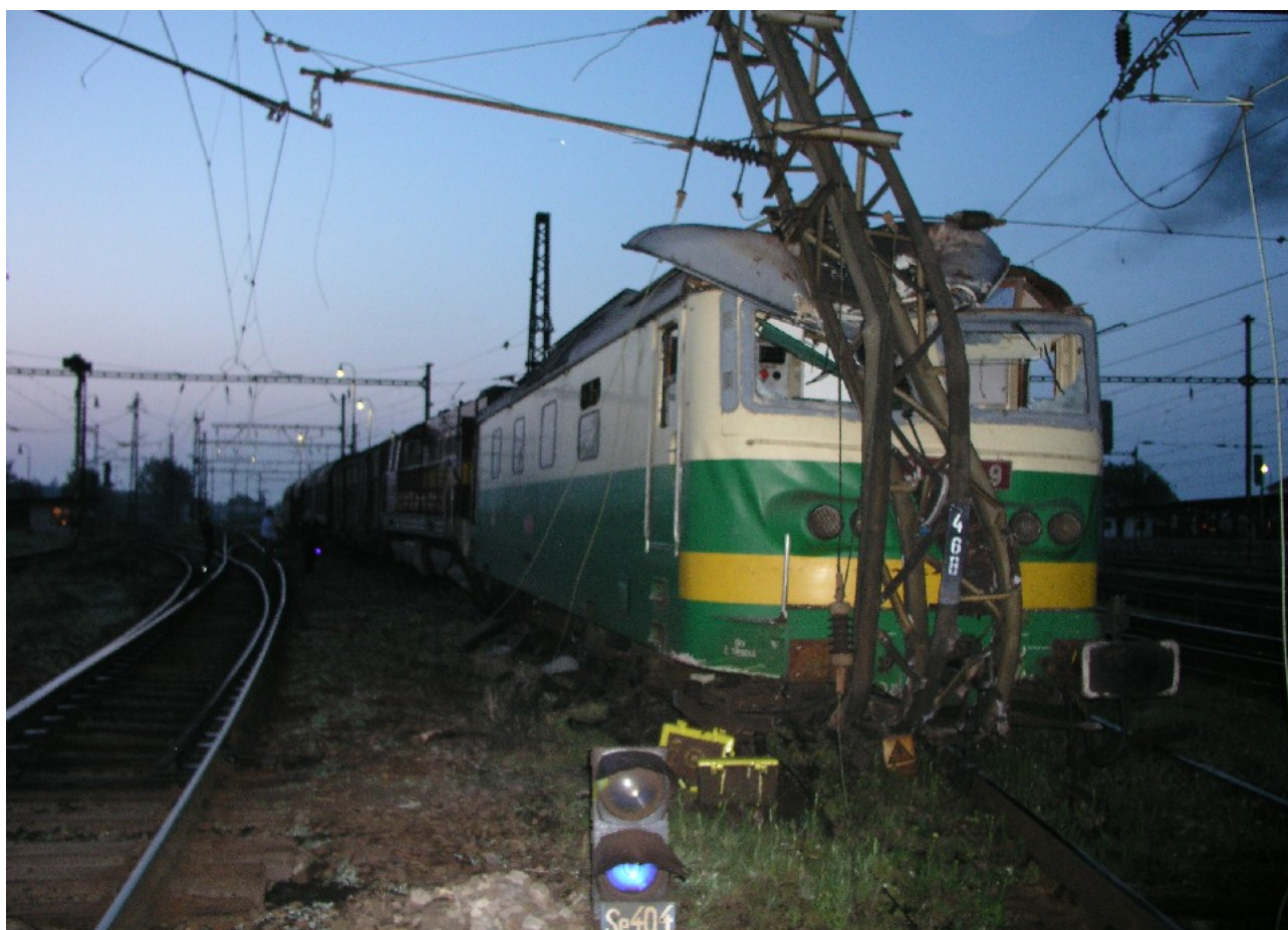
Foto 1: Protlačení HDV za zarážedlo kusé koleje č. 105b vlakem č. 64922