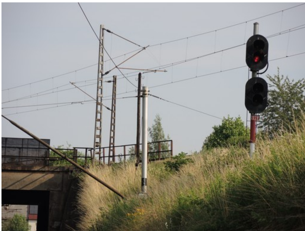
Obr. č. 6: Detail umístění návěstidla LV