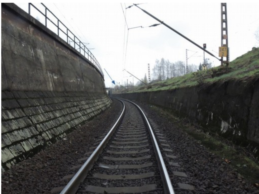
Obr. č. 5: Návěstidlo LV ze vzdálenosti 201 m