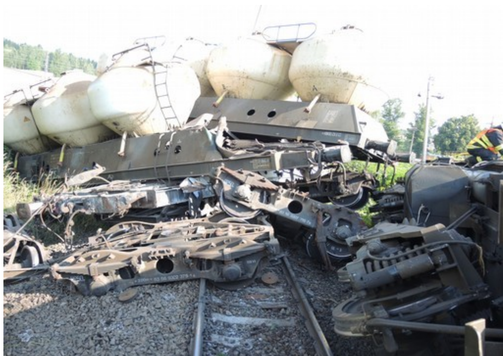
Obr. č. 4: Poslední čtyři TDV vlaku Pn 63710