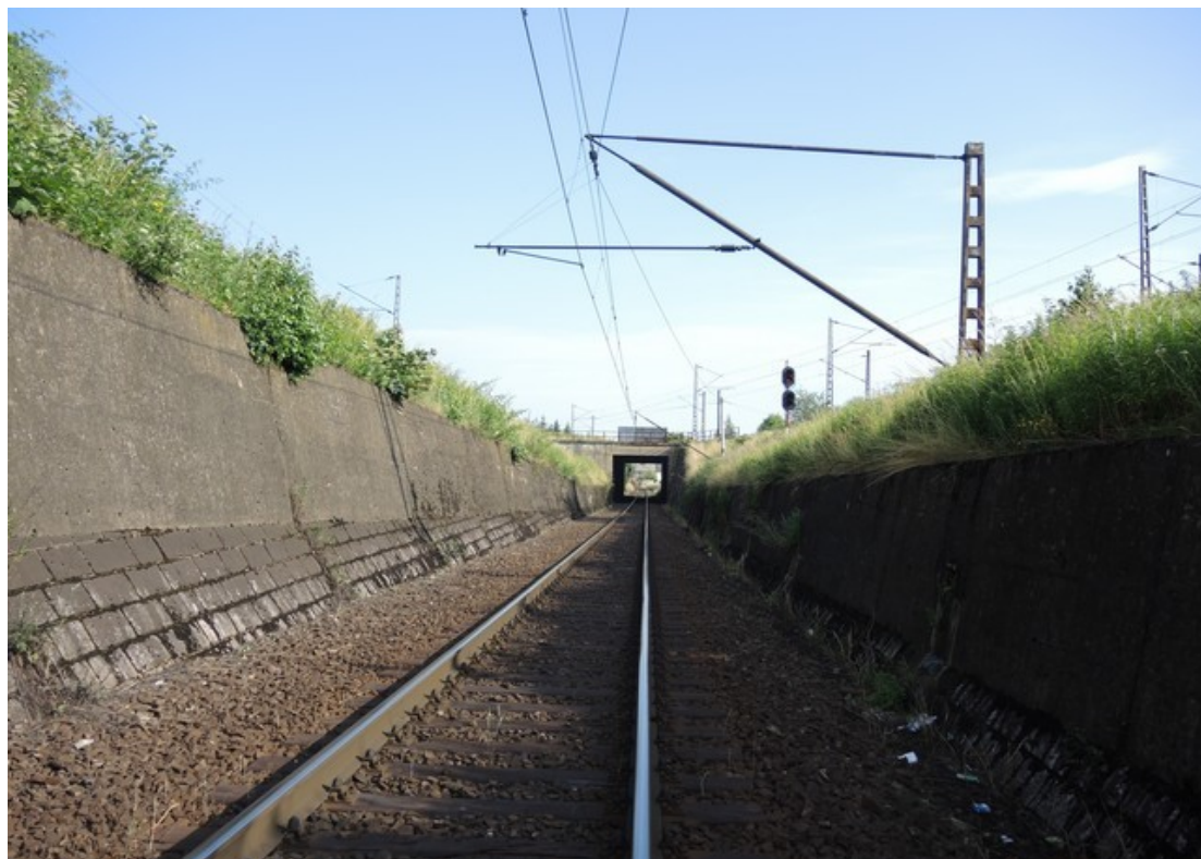
Obr. č. 7.: Viditelnost návěstidla ze vzdálenosti 133 m