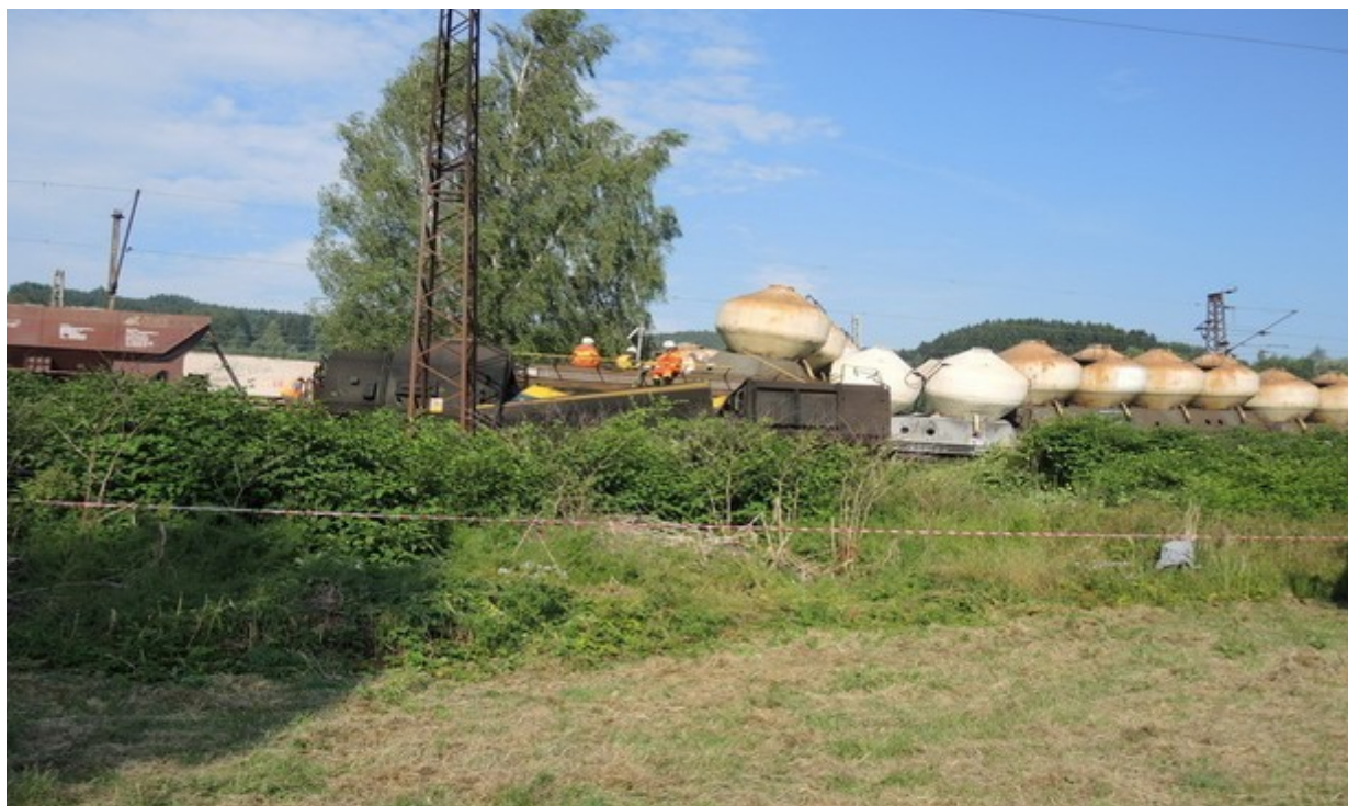
Obr. č. 1: Pohled na místo MU