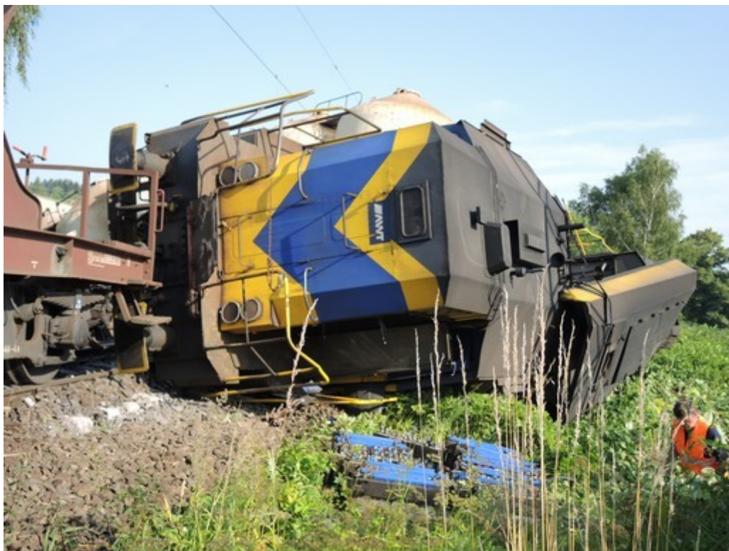
Obr. č. 3: Vlakové HDV po srážce – pohled ve směru jízdy