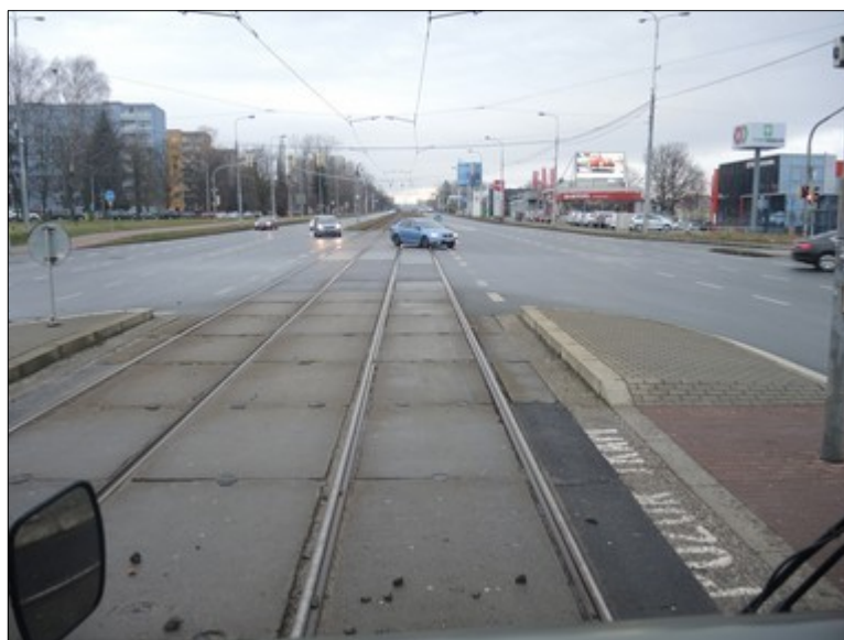
Obr. č. 4: Pohled na kolej č. 1 před DV přes čelní sklo kabiny řidiče ze stanoviště řidiče TVL linky č. 3, kurz 105.