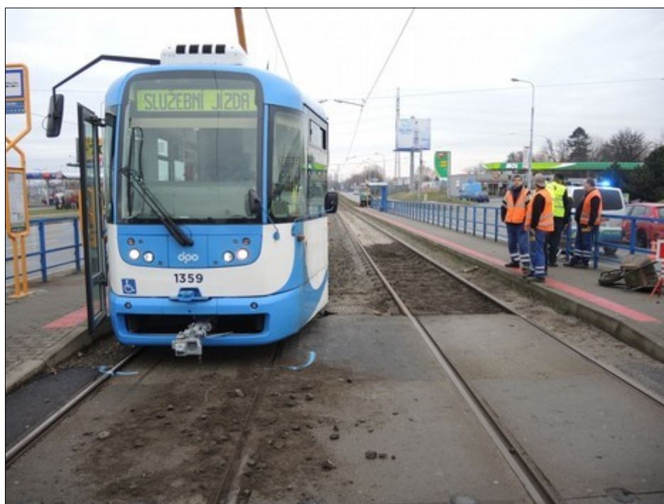
Obr. č. 1: Pohled na přední čelo TVL linky č. 3, kurz 105, v konečném postavení po MU, vč. následkem srážky vysypaného obsahu stavebního kolečka a stavebního kolečka po MU nedovoleně přemístěného na nástupiště zastávky směr centrum.