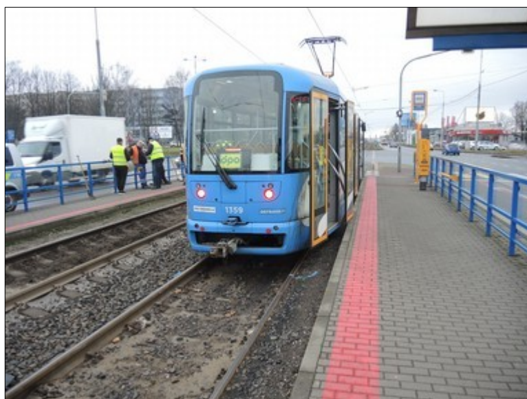
Obr. č. 5: Pohled na DV TVL linky č. 3, kurz 105, v konečném postavení v zastávce Zahrádky po MU.