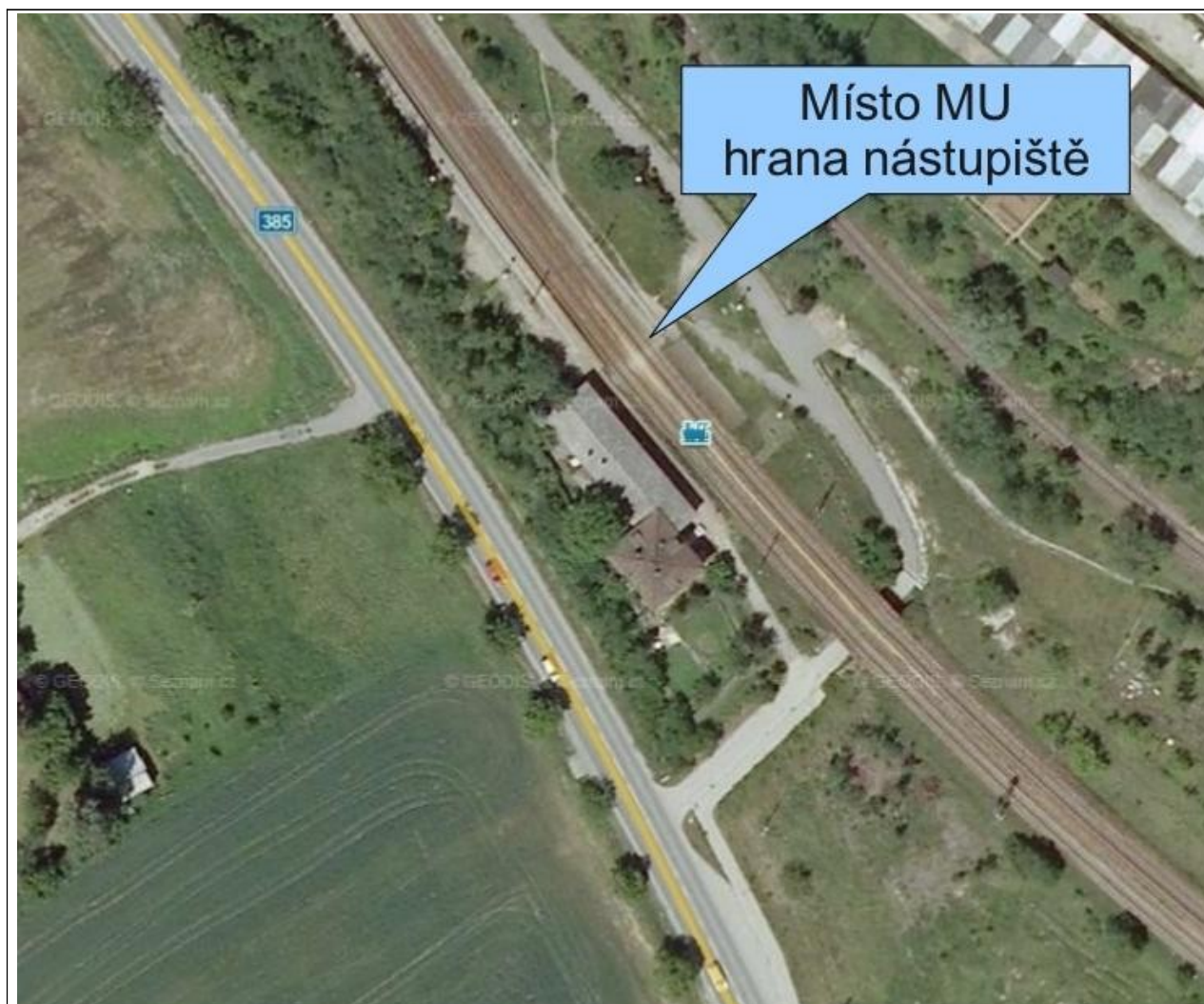
Obr. č. 2: Místo vzniku MU – hrana nástupiště 2. traťové koleje zastávky Hradčany