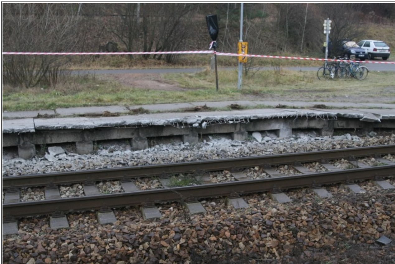
Obr. č. 1: Poškozené nástupiště na zastávce Hradčany.

Ke vzniku MU došlo dne 22. 11. 2011 ve 23:15 h na dráze železniční, kategorie celostátní, v 2. traťové koleji trati 324, Brno hl. n. – Kutná Hora hl. n., mezi žst. Kuřim a Tišnov, v km 27,832, zastávka Hradčany.