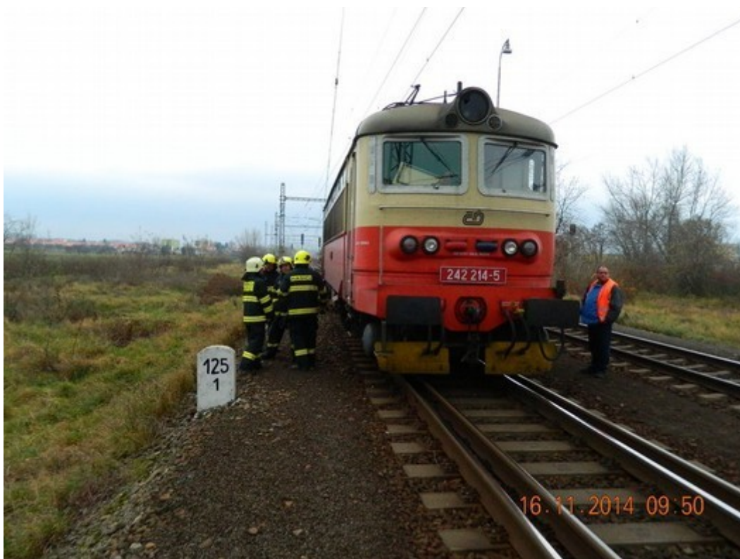
Obr. č. 7: HDV 242 214-5 s poškozeným reflektorem