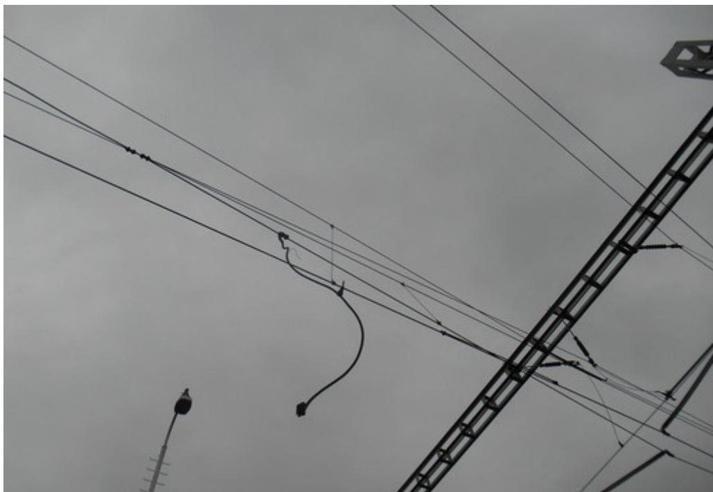
Obr. č. 3: Vyražená spojka proudového propojení v žst. Hrušovany u Brna