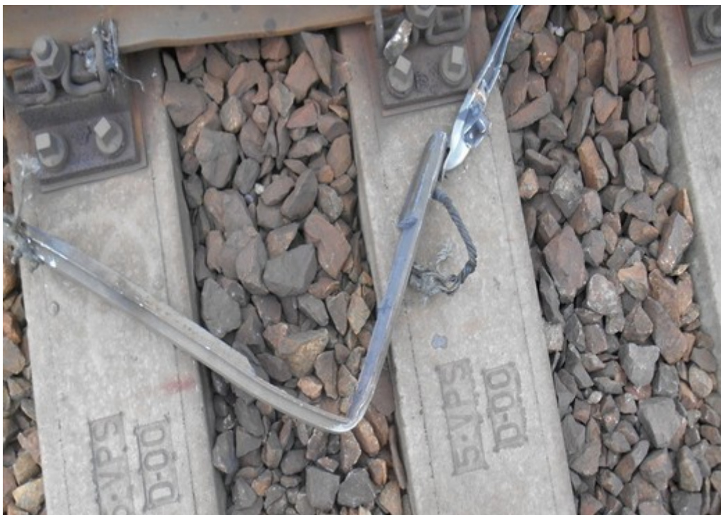
Obr. č. 6: Lišta sběrače č. 1, HDV 362 023-4, první ve směru jízdy vlaku, nalezená v km 118,400 na výhybce č. 25 v žst. Vranovice