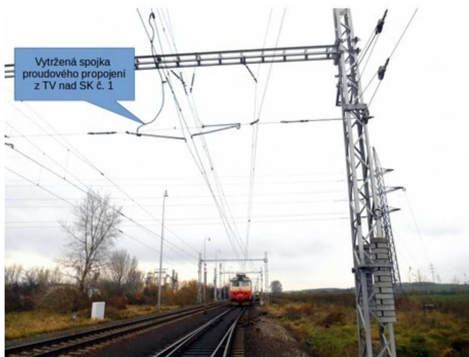
Obr. č. 1: Pohled na místo MU