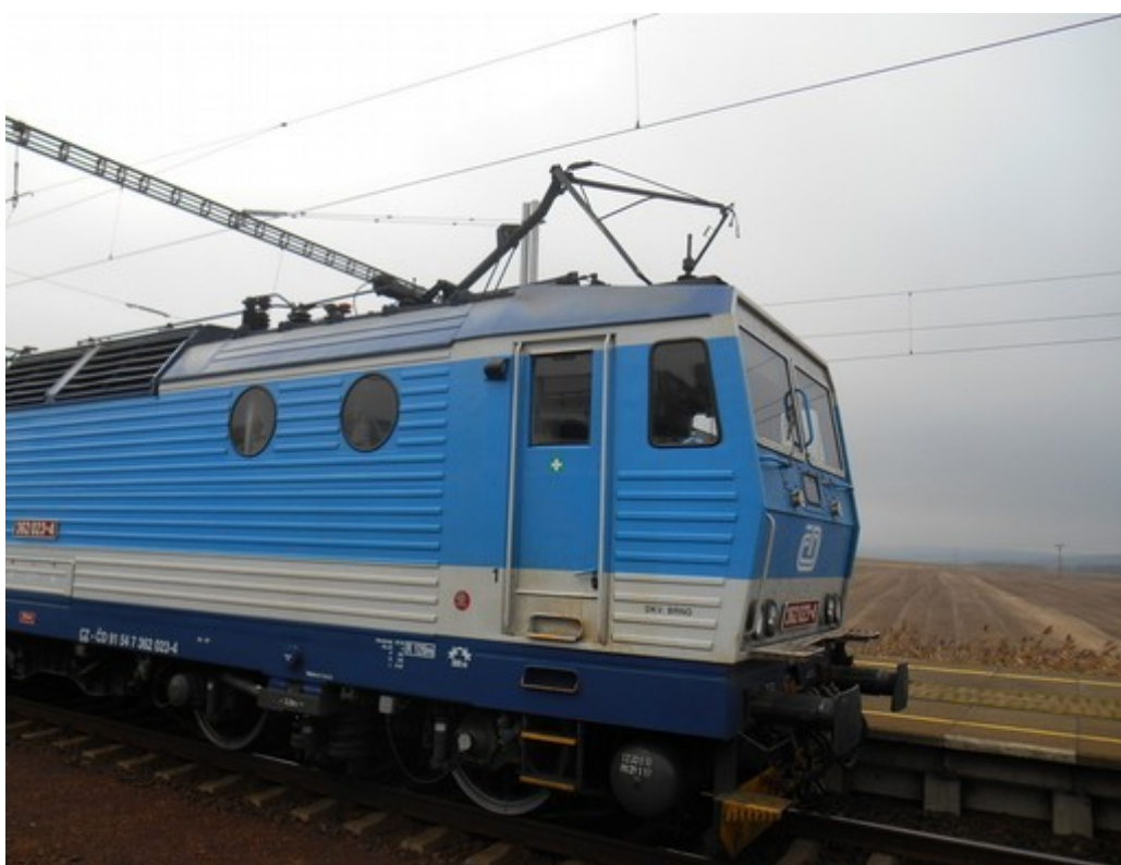
Obr. č. 4: HDV vlaku R 803 po zastavení v žst. Šakvice