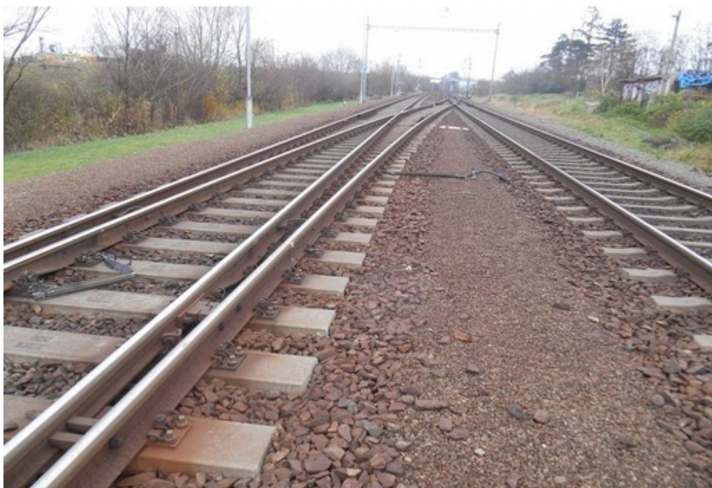
Obr. č. 5: Místo poškození TV a sběrače v žst. Vranovice