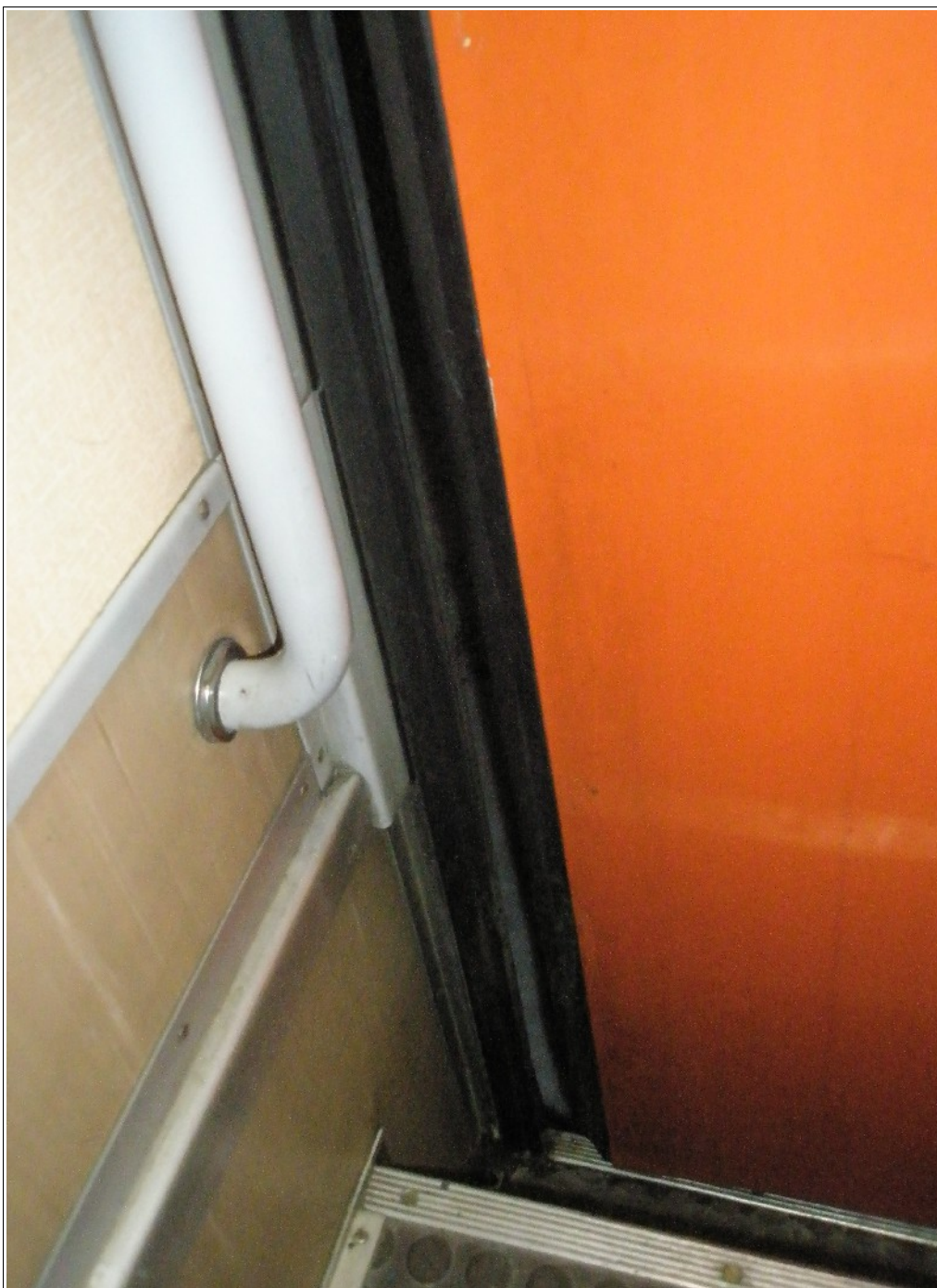
Foto č. 3 - Pohled z nástupního prostoru na pravé jednokřídlové nástupní dveře – stav po MU