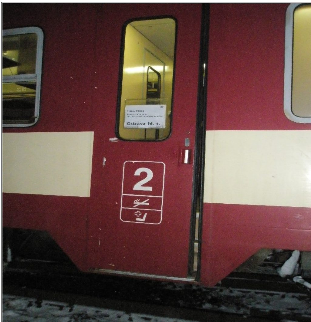
Foto č. 2 – Pohled na pravé přední jednokřídlové nástupní dveře – stav po MU