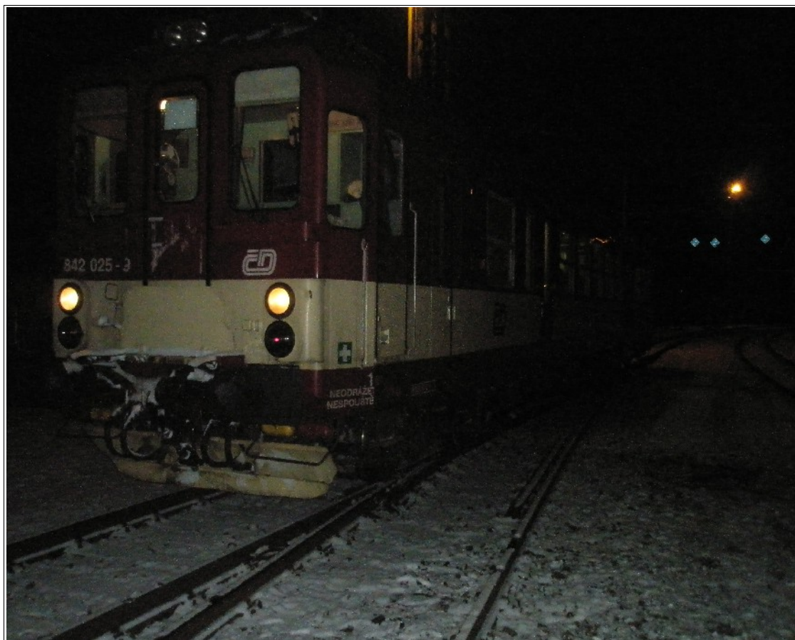
Foto č. 1 – pohled na HDV 842.025-9 po MU