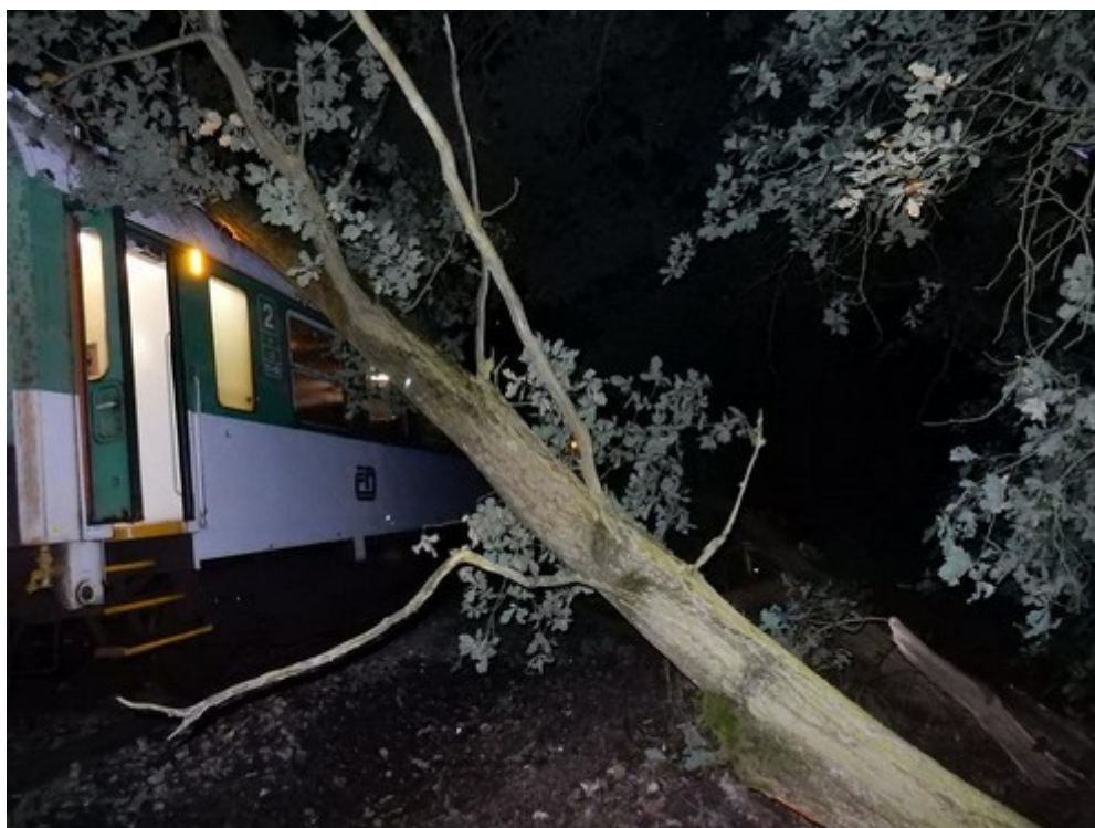
Obr. č. 3: Pohled na poslední spadlý strom zaklíněný na střeše posledního DV