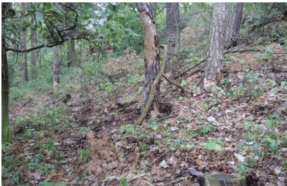
Obr. č. 5: Skupina uschlých stromů v dopadové vzdálenosti od traťové koleje