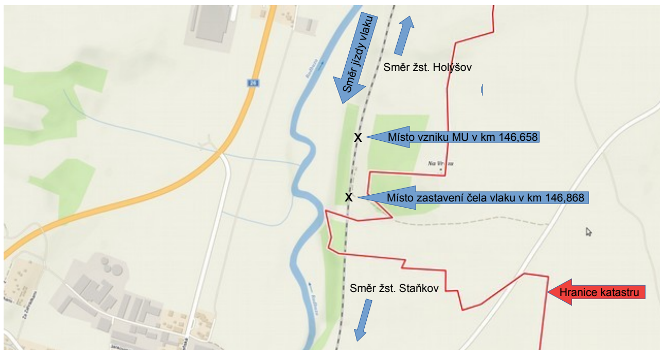
Obr. č. 2: Schéma místa vzniku MU

z pravostranného oblouku spatřil na vzdálenost asi 150 m tmavou překážku (stromy) na koleji. Neprodleně zavedl rychločinné brzdění a z důvodu své vlastní bezpečnosti vběhl do strojovny lokomotivy, odkud slyšel, jak čelo vlaku najíždí do popadaných stromů. Vlak nevykolejil, čelo vlaku zastavilo v km 146,658, tj. 210 m za místem vzniku MU. Došlo k poškození HDV a jednoho TDV (ve vlaku řazeného jako poslední), nedošlo ke zranění osob.