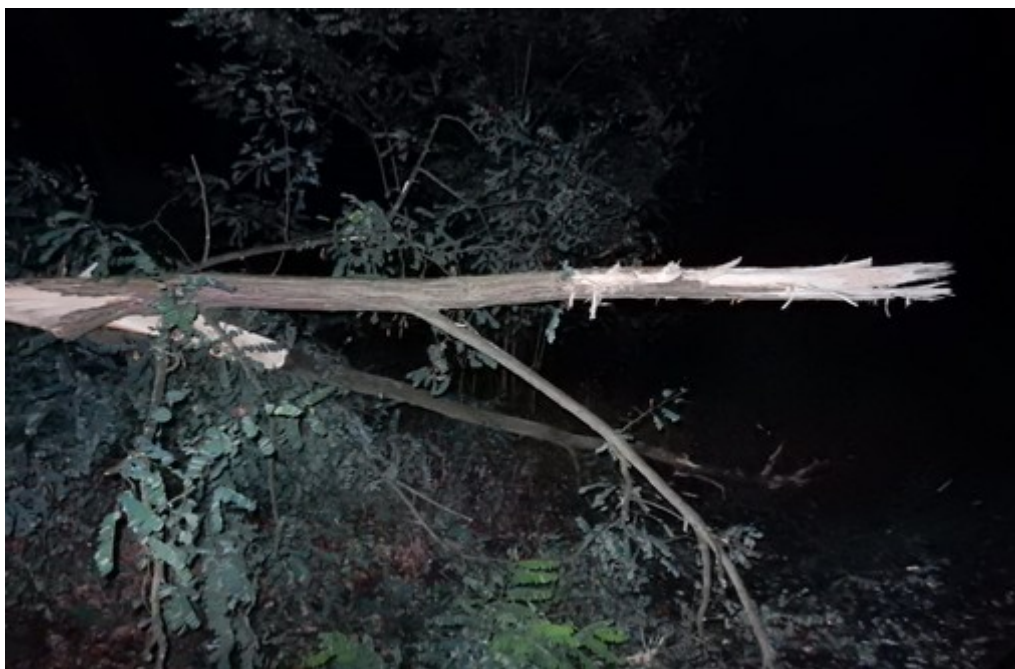
Obr. č. 1: Pohled na první zlomený strom v úrovni km 146,671