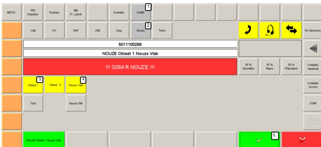
Obr. č. 6: Zadávací obrazovka obslužného panelu TOP1