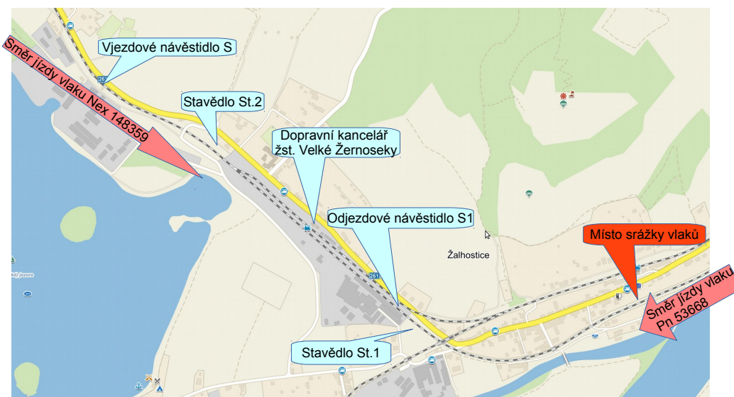
Obr. č.: 2: Mapa místa vzniku MU

Dne 28. 3. 2015 v 8.38 h došlo na 1. traťové koleji mezi žst. Velké Žernoseky a Litoměřice dolní nádraží ke srážce vlaku Nex 148359 s protijedoucím vlakem Pn 53668.