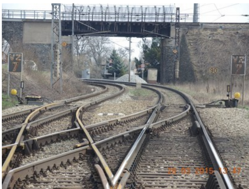
Obr. č.: 3: Pohled na výhybku č. 1 ve směru z 1. SK žst. Velké Žernoseky na 1. TK do žst. Litoměřice