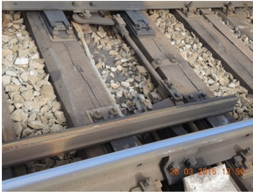
Obr. č. 4: Stopy po okolcích DV na vnitřní straně jazyka výhybky č. 1