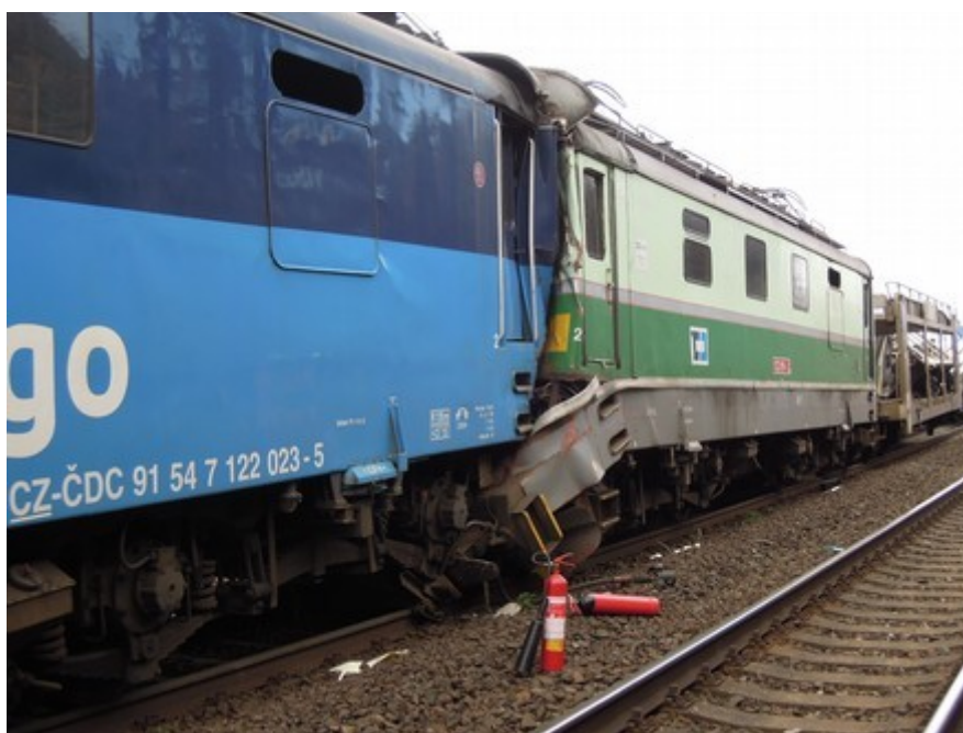
Obr. č. 1: Místo srážky vlaků – vlevo vlak Pn 53668, vpravo vlak Nex 148359