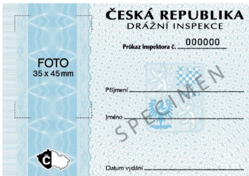
Obrázek - Vzor průkazu