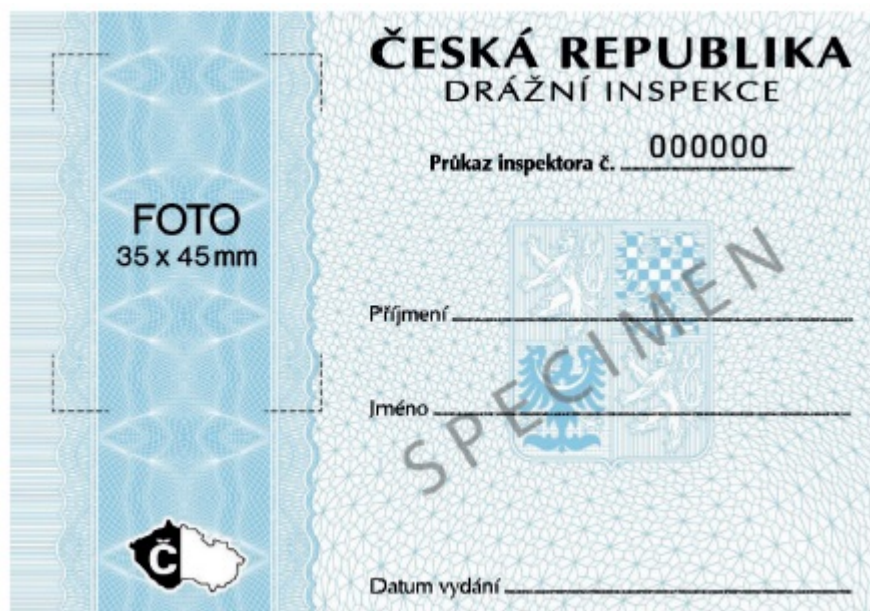
Obrázek - Vzor průkazu