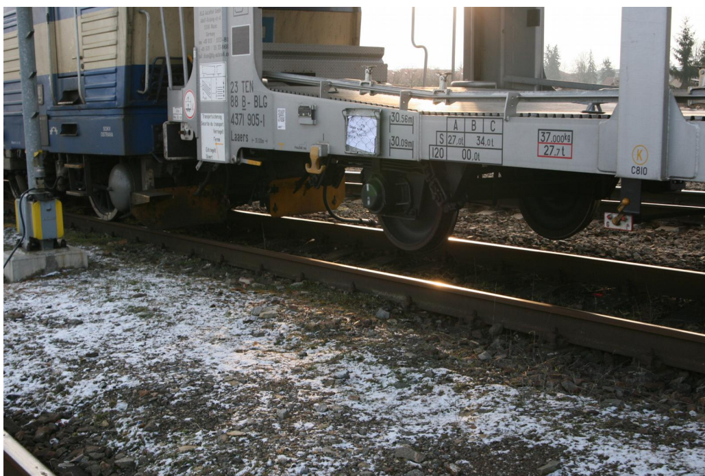
Obr. č. 5: Sražená vozidla