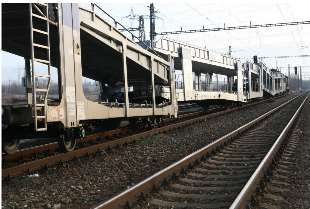
Obr. č. 4: Sražená vozidla