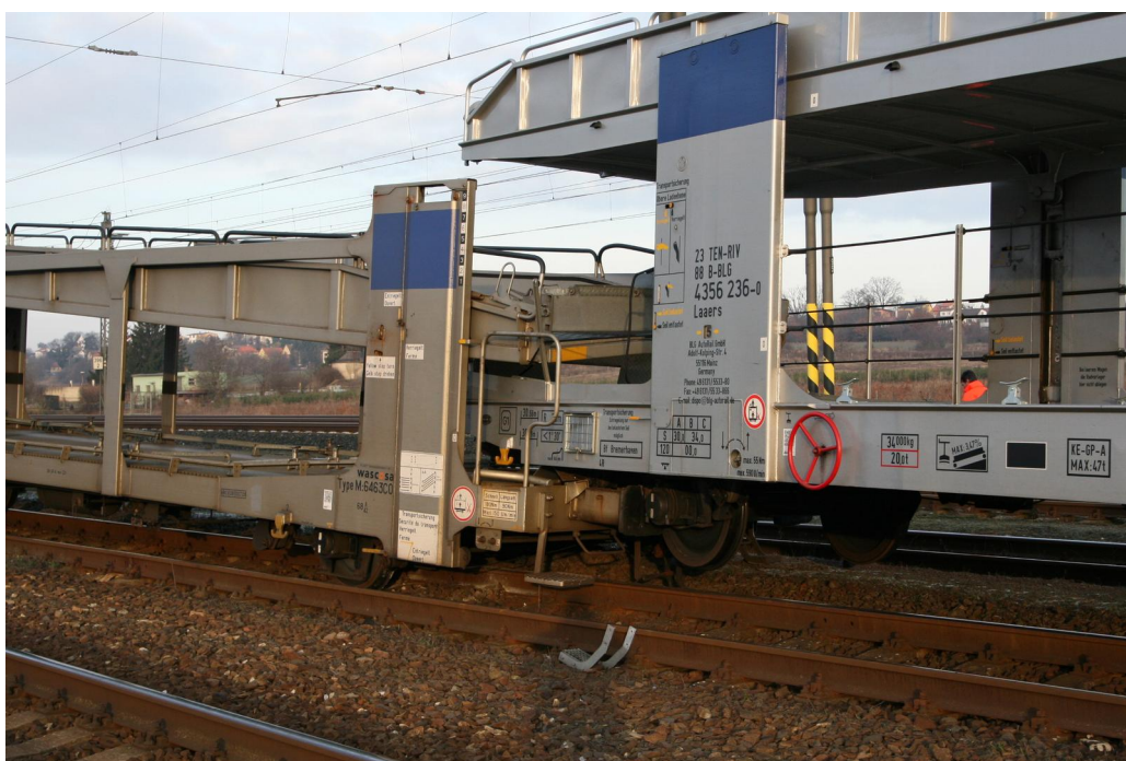
Obr. č. 6: Sražená vozidla