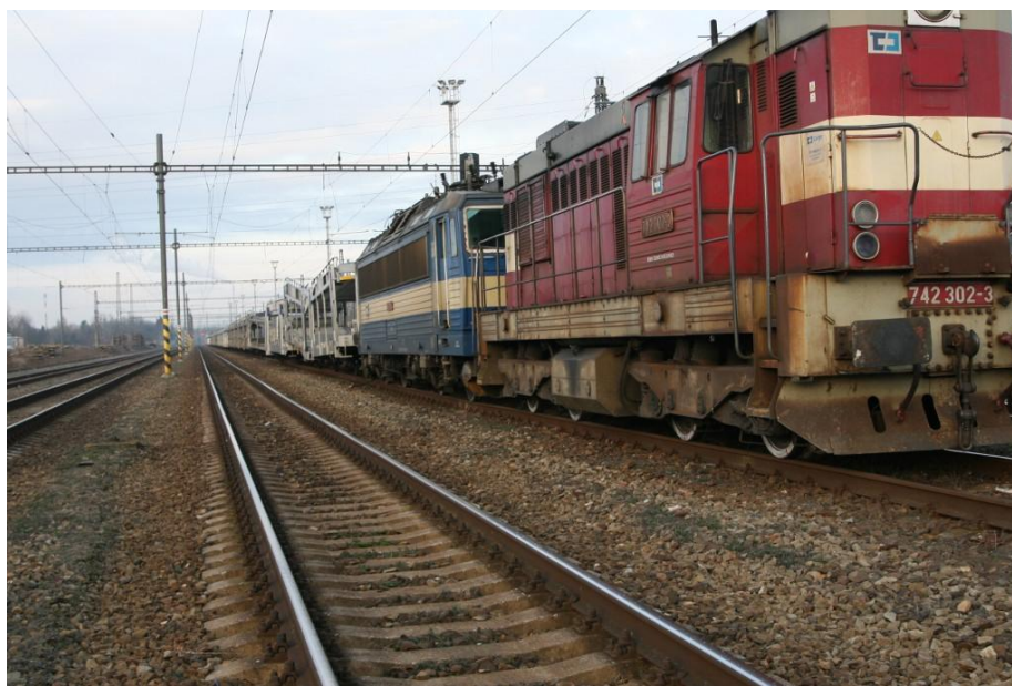
Obr. č. 1: Pohled na místo MU