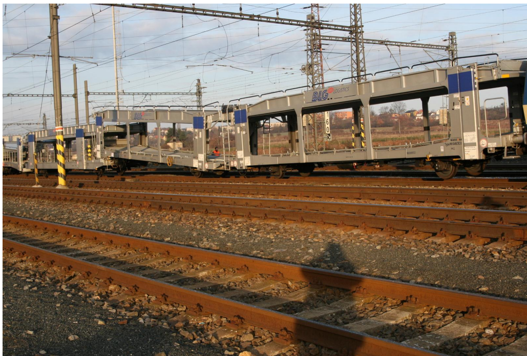
Obr. č. 3: Sražená vozidla