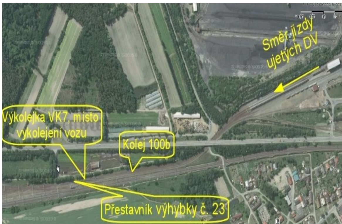
Obr. č. 3: Situace místa MU