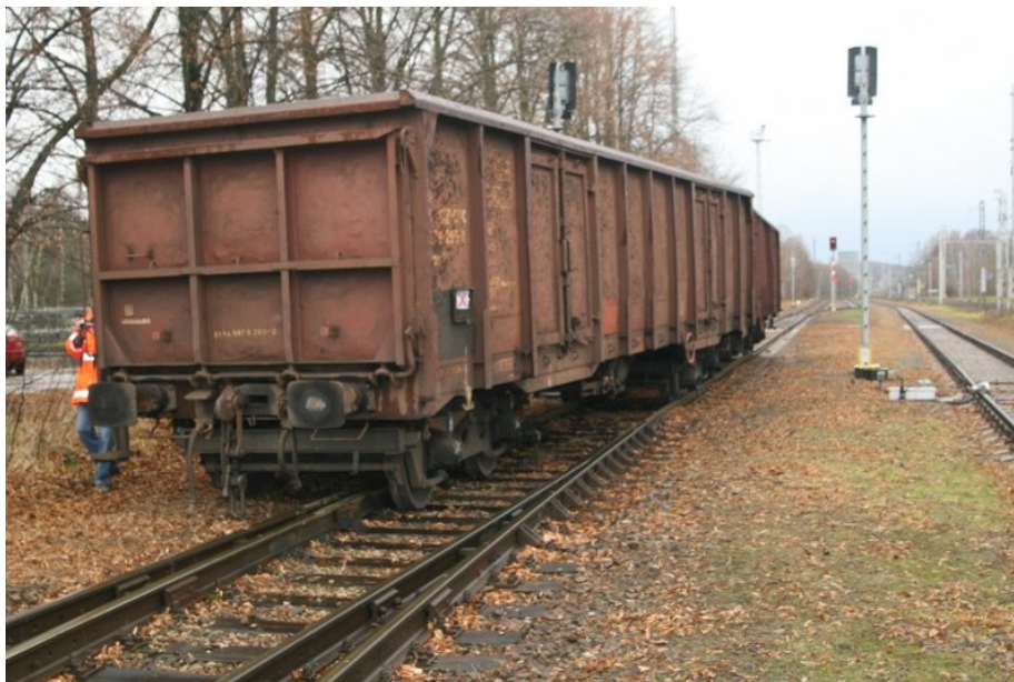
Obr. č. 1: Pohled na místo MU

K mimořádné události došlo dne 8. 12. 2011 v 6:48 h na dráze-vlečce „Vlečka ČEZ, a.s. - elektrárna Chvaletice“, výkolejka Vk7 v km 0,058, přípojová stanice Řečany nad Labem.