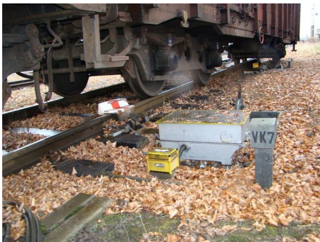
Obr. č. 5: Pohled na vykolejené podvozky