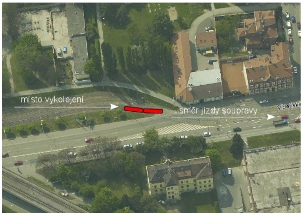
Obr. č. 2: Místo vzniku MU