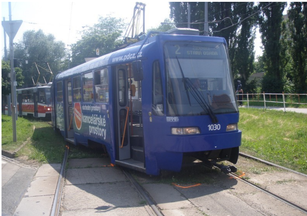
Obr. č. 1: Pohled na místo MU