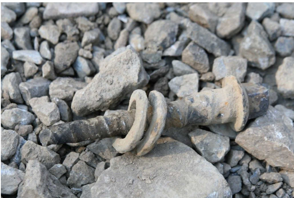
Obr. č. 4: Detail stavu upevňovadla – vrtule