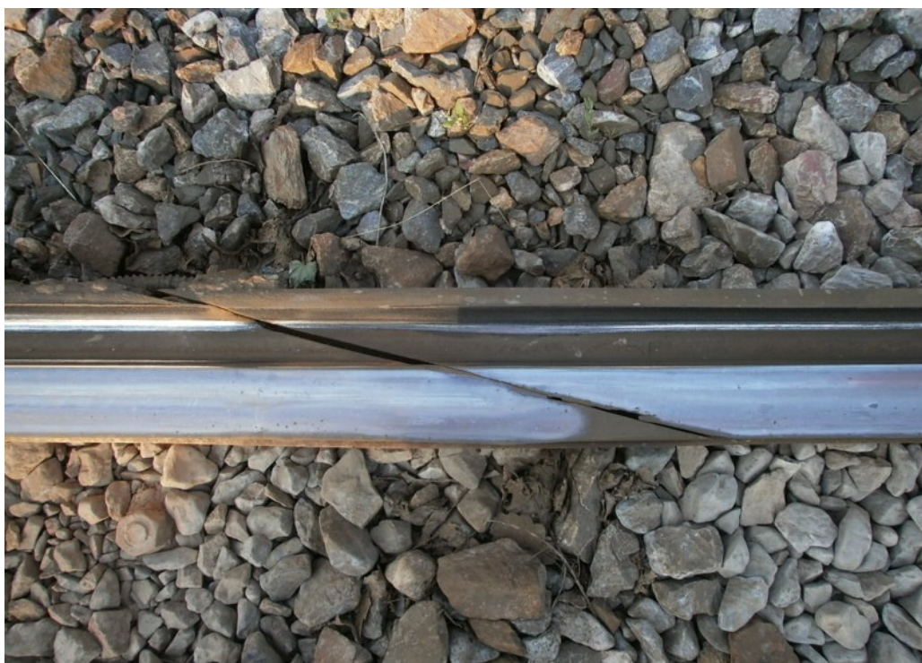
Obr. č. 8: Pohled na dilataci v poloze „na doraz“