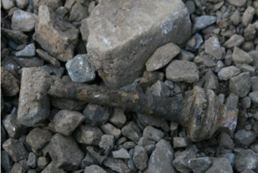
Obr. č. 5: Detail stavu upevňovadla – vrtule