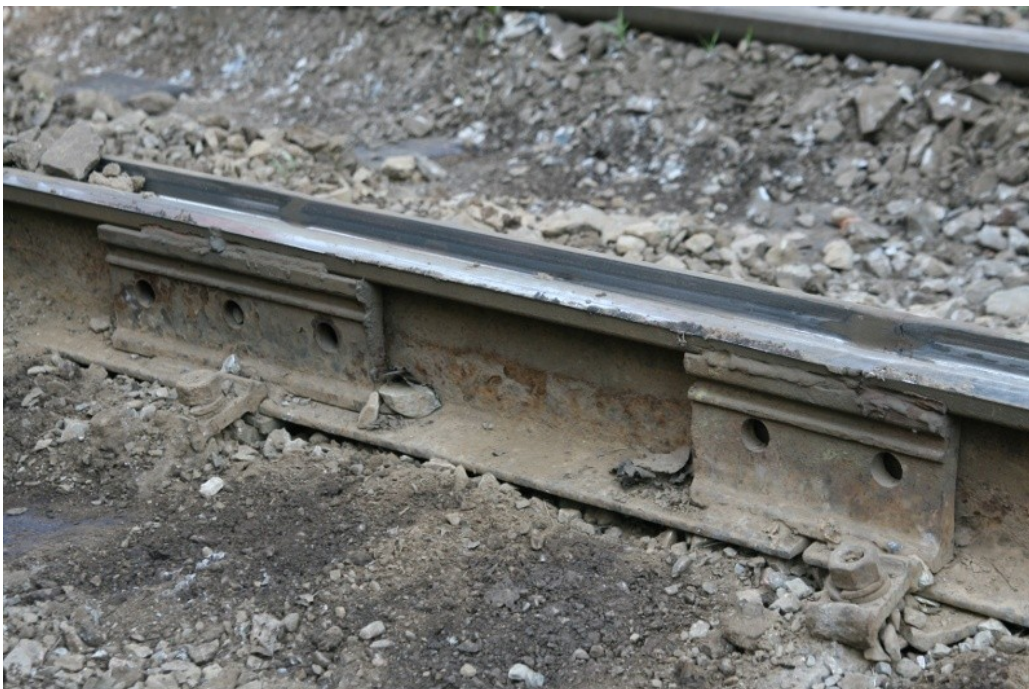
Obr. č. 6: Detail stavu upevňovadel – svěrek