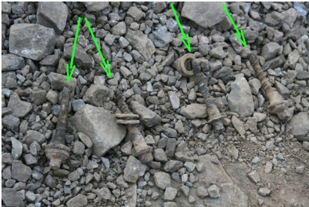
Obr. č. 3: Ukázka stavu 4 po sobě jdoucích upevňovadel – vrtulí