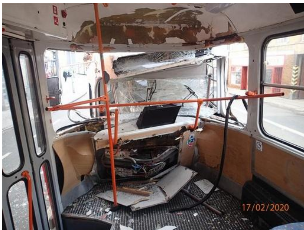
Obr. č. 4: Pohled na čelo tramvaje linky č. 6 z druhého vozu soupravy linky č. 2