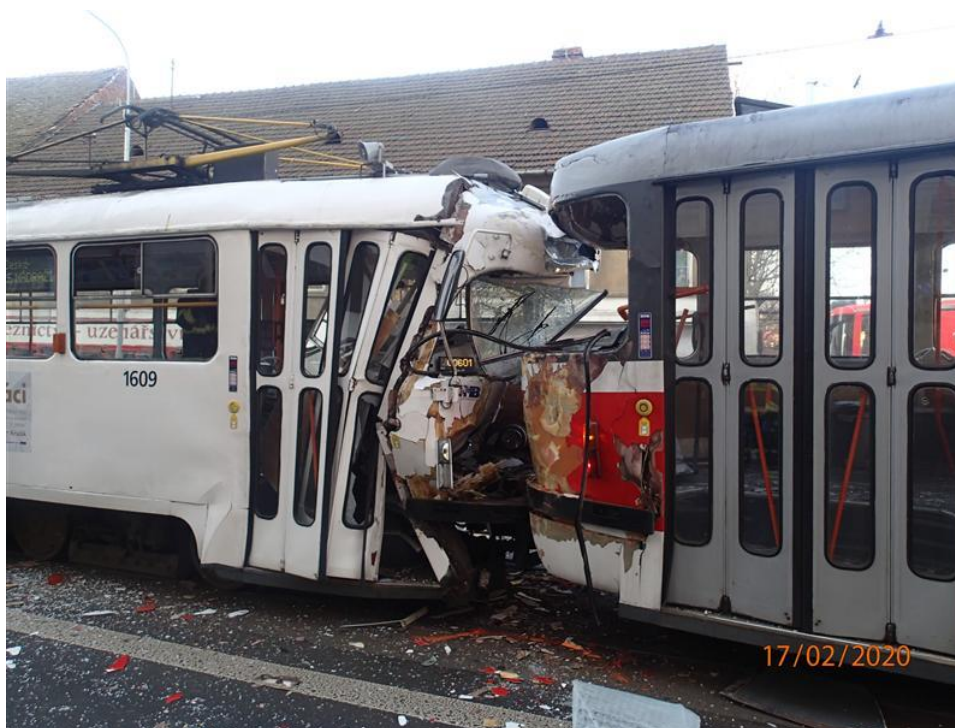
Obr. č. 1: Místo srážky DV