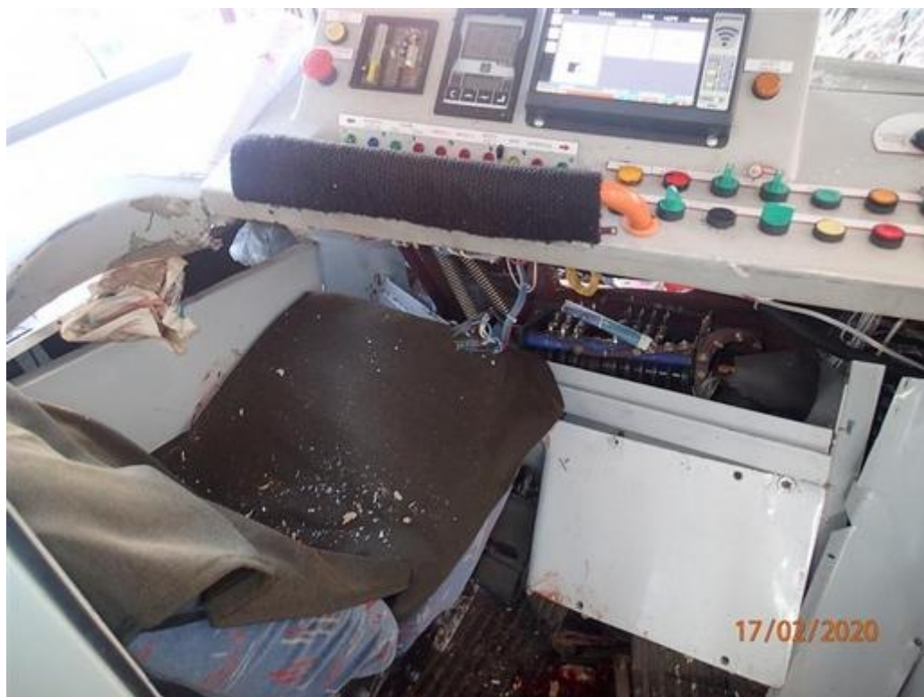
Obr. č. 5: Kabina řidiče tramvaje linky č. 6 po vzniku MU