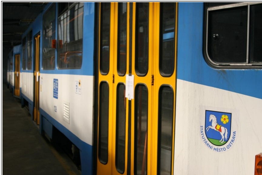
Obr. 5 Snímek dokumentující zaplombování dveří TVL linky č. 17, kurz 102, po MU.