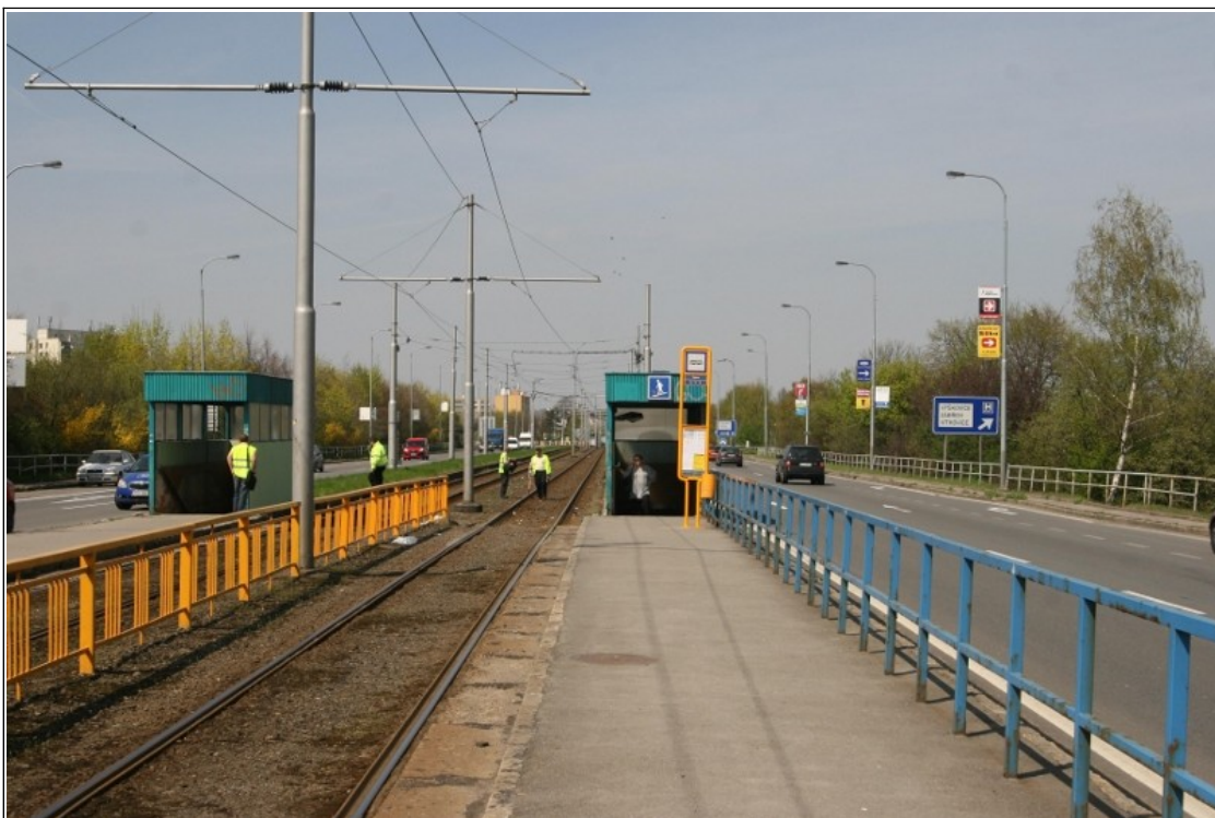
Obr. 1 Snímek ze dne 21. 04. 2011 dokumentuje prostorové uspořádání zastávky Tylova (směr jízdy TVL Nová Ves vodárna).

K MU došlo dne 21. 04. 2011 ve 12:24:49 h na dráze tramvajové „Dopravní podnik Ostrava a.s.“, v prostoru zastávky Tylova (směr jízdy TVL Vřesinská).