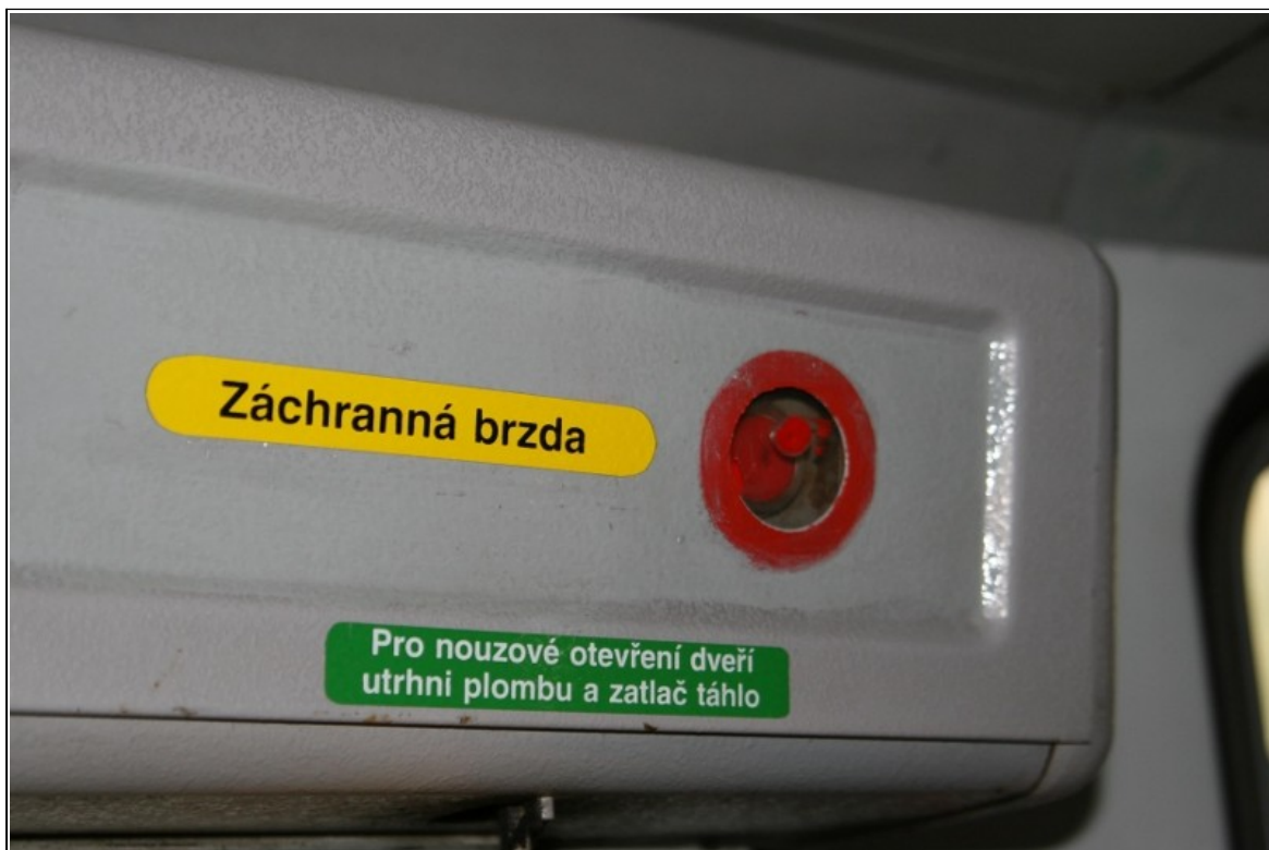
Obr. 4 Umístění a označení spínače záchranné brzdy na krytu dveřního mechanismu prvních dveří řízeného DV TVL linky č. 17, kurz 102.

Dne 22. 04. 2011 bylo v areálu dopravce a vlastníka DV MTV ve vozovně Poruba provedeno „Komisionální zjištění technického stavu drážního vozidla“, DV MTV typ T6A5 – CS, ev. č. 1122, za účasti zástupců DPO, a. s., DI a PČR Městského ředitelství Ostrava (Územní odbor služby kriminální policie a vyšetřování), s následujícím zjištěním: