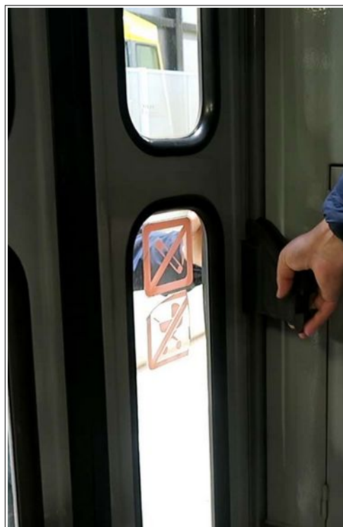
Obr. č. 5: Ruka sevřená mezi křídlem a rámem dveří