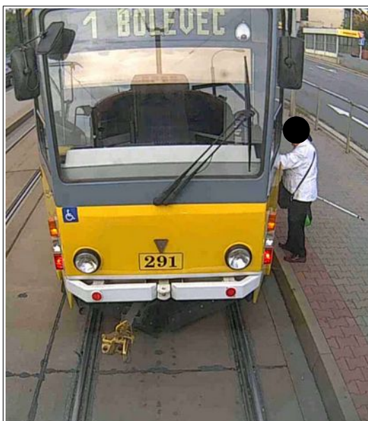
Obr. č. 2: Nástup cestující