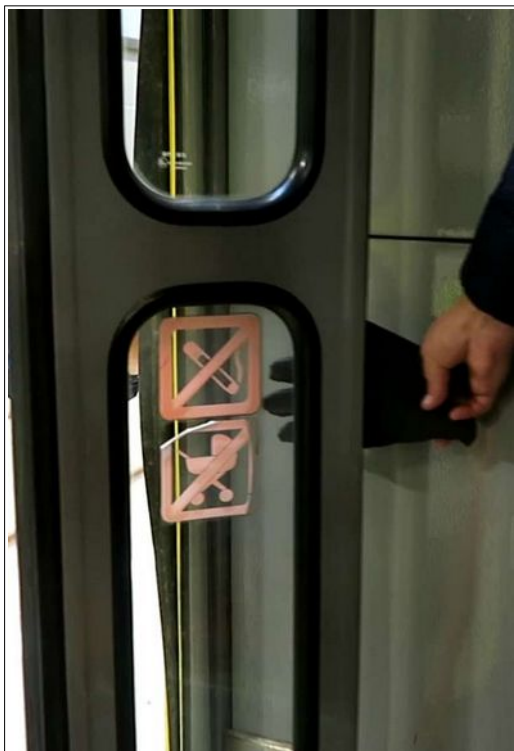
Obr. č. 4: Ruka na hraně křídla dveří