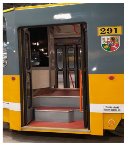
Obr. č. 3: Umístění madla

Dne 27. 10. 2023 byl ve vozovně PMDP inspektory DI ve spolupráci s odborně způsobilými osobami dopravce proveden ověřovací pokus za účelem zjištění, za jakých podmínek dojde k uzavření zadních nástupních dveří vozu č. 291 (ve směru jízdy tramvaje dne 19. 10. 2023) s překážkami v prostoru dveří o různé šířce a následnému rozjezdu předmětné tramvaje, tj. ověření funkčnosti blokování jízdy tramvaje při nedovřených dveřích.