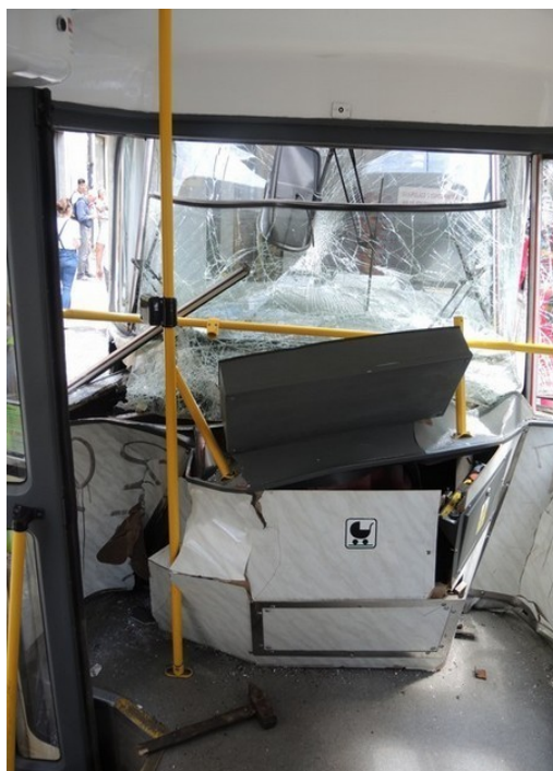
Obr. č. 5: Interiér DV ev. č. 8182

DV ev. č. 8182, typu Tatra T3R.PV (první DV prvního tramvajového vlaku), čelo vozu se nacházelo v úrovni začátku fyzické hranice křižovatky Ječné ulice a Karlova náměstí (v místě zakřivení okraje vozovky) v prostoru přechodu pro chodce. Předmětné DV bylo poškozeno zejména v zadní části, kdy došlo vlivem nárazu od DV ev. č. 8183 mj. k prasknutí a vlomení laminátové části (zadního čela) směrem dovnitř vozu, do interiéru (který nesl zjevné stopy poškození, viz Obr. č. 5). V horní části zadního čela bylo prasklé zadní sklo, které se vysypalo dovnitř DV. Spřáhlo bylo ohnuté pod spodní část DV do pravé strany ve směru jízdy DV. Stanoviště řidiče nebylo vlivem MU viditelně poškozeno, v době vzniku MU se zde nacházel řidič prvního tramvajového vlaku.