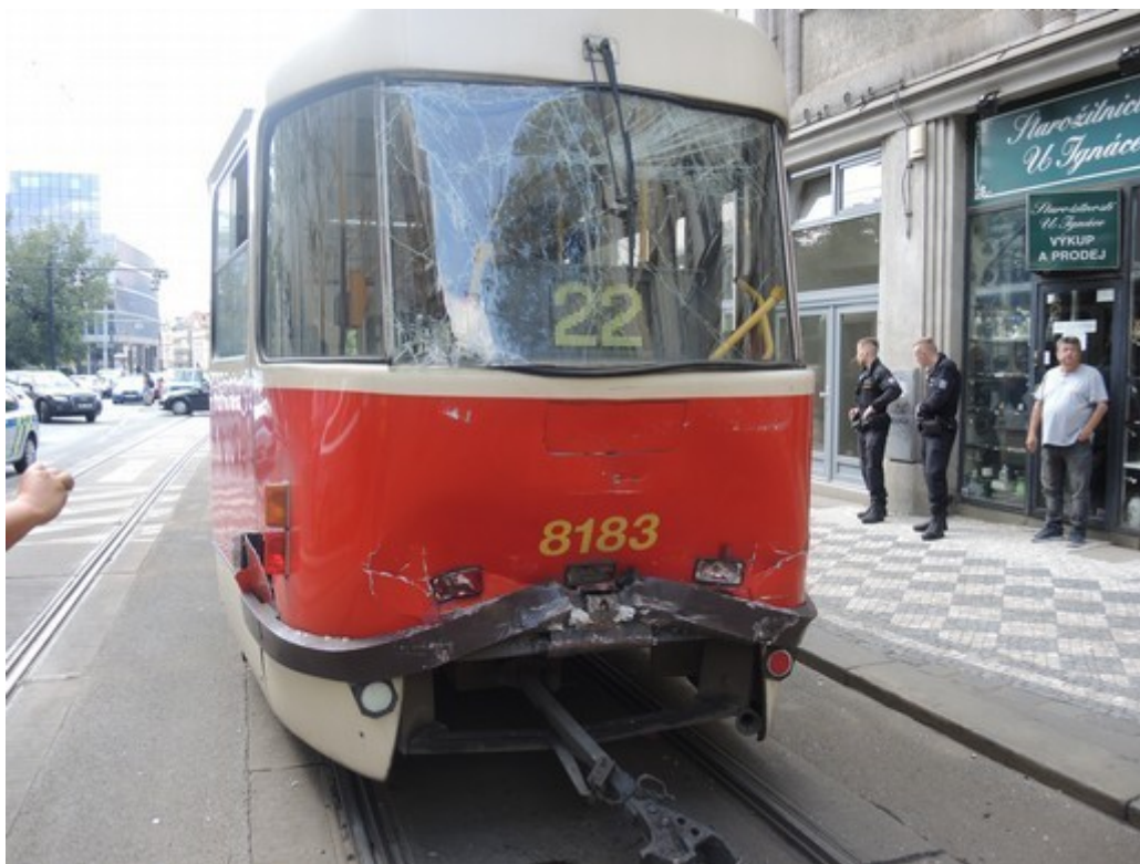
Obr. č. 7: DV ev. č. 8183 při odjezdu z místa MU