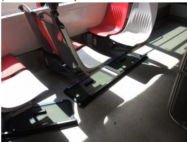
Obr. č. 6: Části oken a madel v prostoru pro cestující

Místo MU nebylo pověřenou odborně způsobilou osobou provozovatele dráhy a dopravce zabezpečeno v souladu s vyhláškou č. 376/2006 Sb.