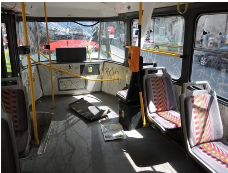
Obr. č. 4: Interiér DV ev. č. 8183