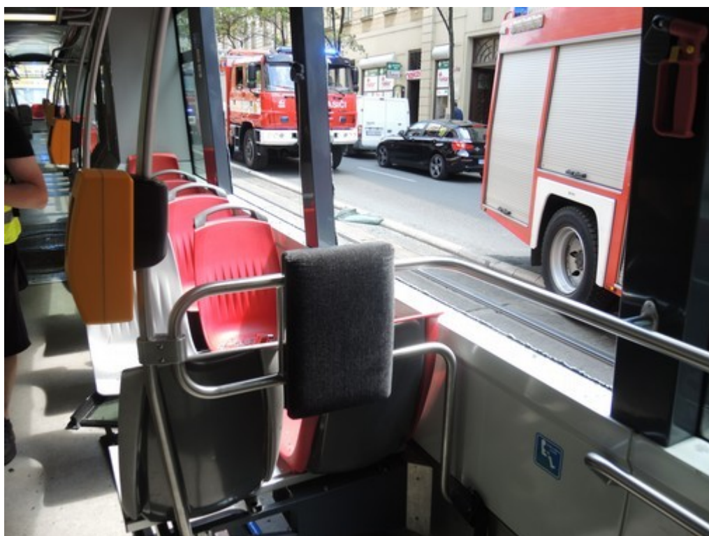
Obr. č. 3: Interiér DV ev. č. 9404

u všech 4 podvozků DV (tato brzda je kotoučová). Ve 14.25 h byla za přítomnosti DI provedena zkouška kolejnicové brzdy s vyhovujícím výsledkem. DV mělo funkční kamerový systém, který však nearchivuje pořízené záznamy. DV bylo vybaveno celovozovou klimatizací včetně stanoviště řidiče. Klimatizace v tomto DV byla funkční (nastavena na 24 °C). Za účasti pověřené osoby DPP a DI byla stažena data z elektronického tachografu (výrobce C.T.M. Praha s.r.o., typ TM12-5, číslo: 1609612). Odchylna tohoto tachografu činila -4 sekundy oproti reálnému času. Dle dat z místa MU činila rychlost nárazu 25,6 km·h -1 . Řidič tohoto DV se na místě vzniku MU při ohledání DI již nenacházel (byl převezen do nemocnice).