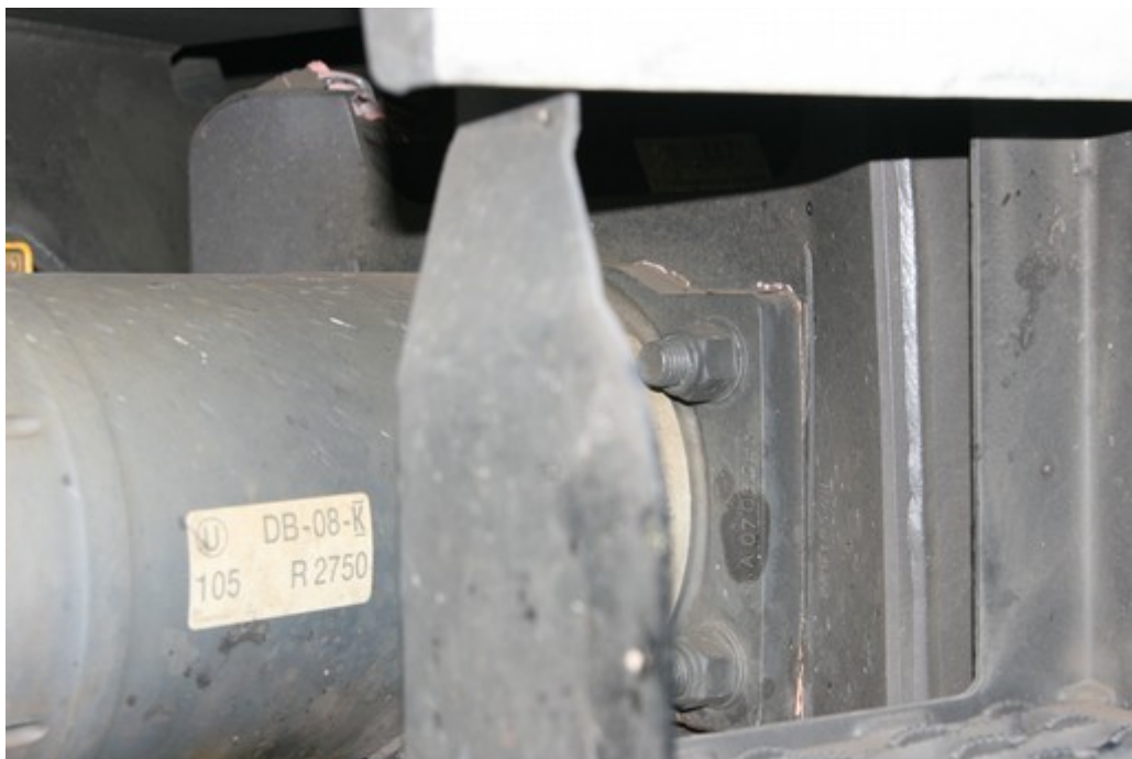
Obr. č. 4: Poškození deformační zóny HDV 91 80 6186 237-4 D-LTE