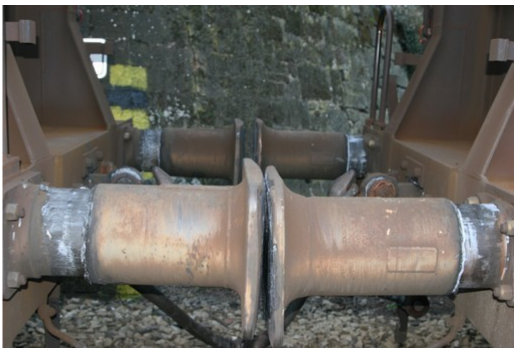
Obr. č. 7: Stlačení nárazníků mezi posledním a předposledním TDV vlaku Nex 48325