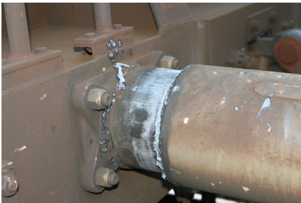
Obr. č. 5: Stlačení levého nárazníku posledního TDV vlaku Nex 48325