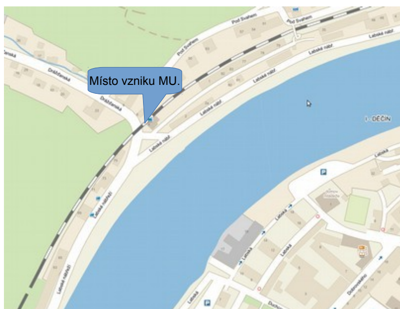
Obr. č. 2: Schéma místa vzniku MU