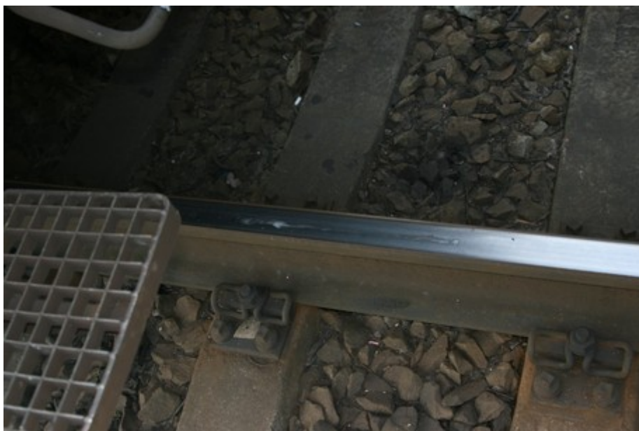
Obr. č. 1: Stopa po posunutí DV vlaku Nex 48325