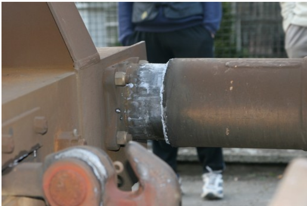
Obr. č. 6: Stlačení pravého nárazníku posledního TDV vlaku Nex 48325