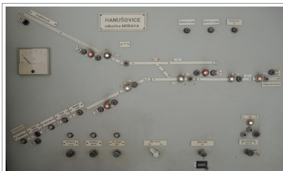
Obr. č. 5: Zhaslé žluté indikační světlo výhybkové dvojice výhybek č. 1 a 2, které nesvícením stálého světla na indikační desce (skřínce) stavědlového (výhybkářského) přístroje St. 1 žst. Hanušovice „HANUŠOVICE odbočka MORAVA“ neindikovalo polohu výhybek „-“ (mínus).