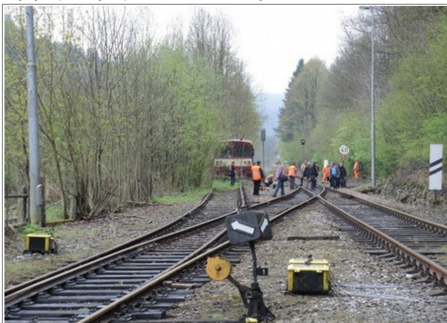
Obr. č. 3: Pohled na místo MU ze směru od hrotů výhybky č. 1 žst. Hanušovice [tzn. od hlavního (vjezdového) návěstidla ML], dokumentující HDV 810.049-7 vlaku Os 13659 v konečném postavení po MU, stojící ve vykolejeném stavu na KSK č. 105.

Výhybka č. 1 žst. Hanušovice v km 1,892 byla vložena roku 1963. Jedná se o jednoduchou výhybku J A-6° I. Lp d nov. na dřevěných kolejnicových podporách, o délce 30,054 m, s jazyky s pérovým podvlakem a hákovým závěrem.