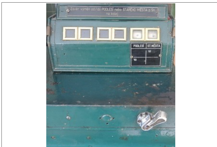
Obr. č. 4: Výměnový radič výhybkové dvojice výhybek č. 1 a 2, situovaný na kovové závěrové skříni stavědlového (výhybkářského) přístroje St. 1 žst. Hanušovice „HANUŠOVICE odbočka MORAVA“, v poloze „-“ (mínus).