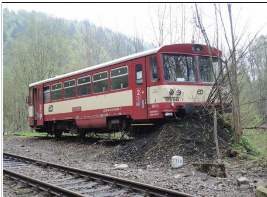
Obr. č. 1: Pohled na místo MU ze směru od stavědla St. 1 žst. Hanušovice, dokumentující HDV 95 54 5 810 049-7 vlaku Os 13659 v konečném postavení po MU, tzn. po srážce se zemním zarážedlem KSK č. 105 a ve vykolejeném stavu.