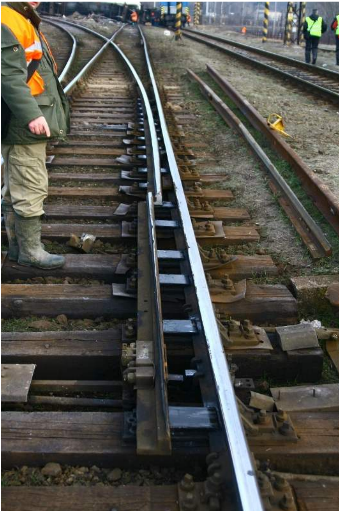
Foto 2: Lom jazyka; vedle výhybky leží nový jazyk a opornice připravené k výměně