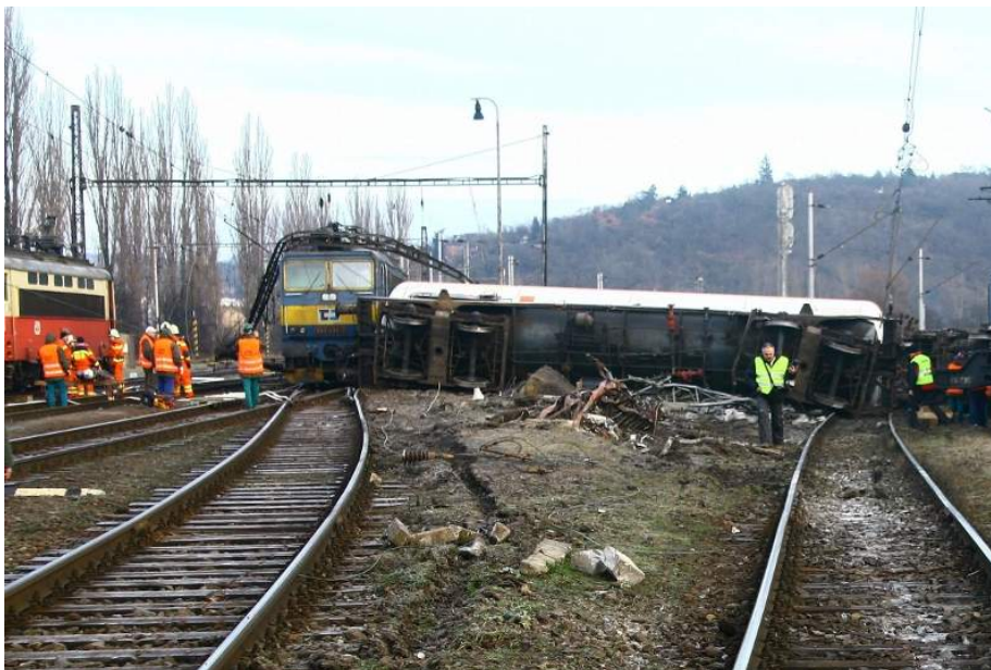
Pohled na místo MU ve směru od výhybky č. 43

K mimořádné události došlo dne 22. 01. 2011 ve 22:02 hodin na dráze železniční, celostátní, trať Odbočka Brno-Židenice – Svitavy, žst. Brno-Maloměřice, v prostoru výhybky č. 43, v km 160,662.