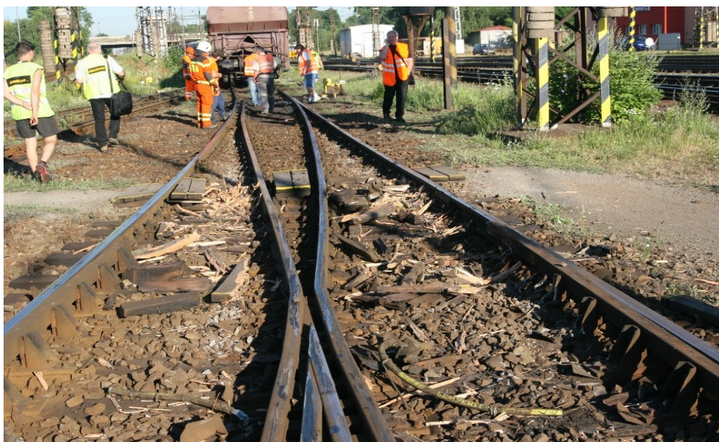
Obr. č. 6: Pohled na kolejiště po MU