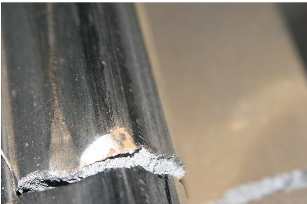
Obr. č. 5: Stopy po naražení okolků DV