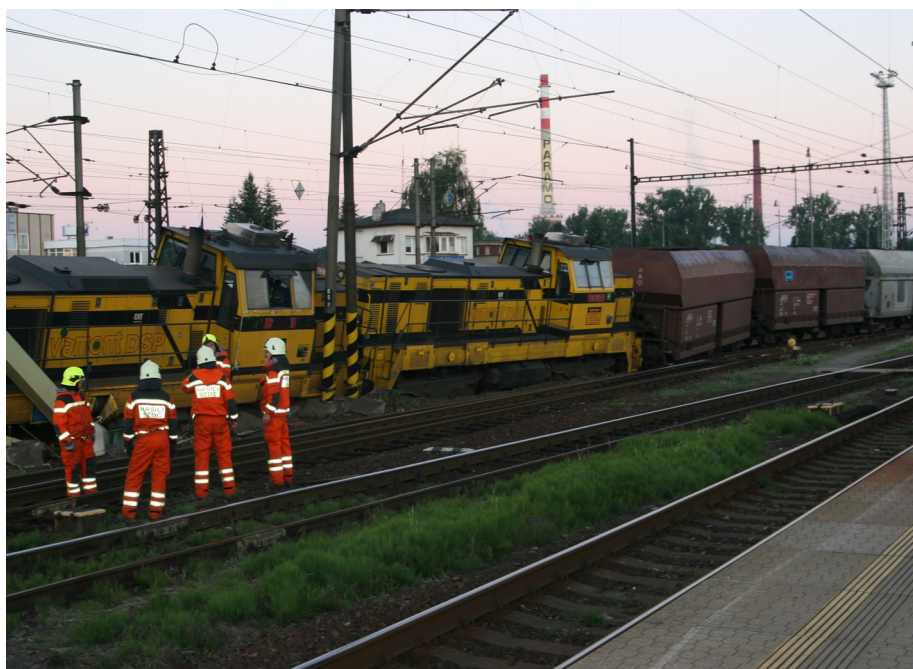
Obr. č. 1: Místo zastavení vlaku po MU