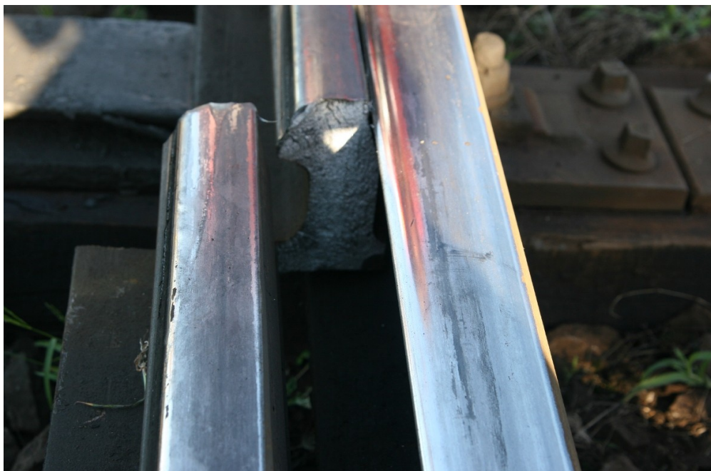
Obr. č. 3: Lom jazyka výhybky č. 75