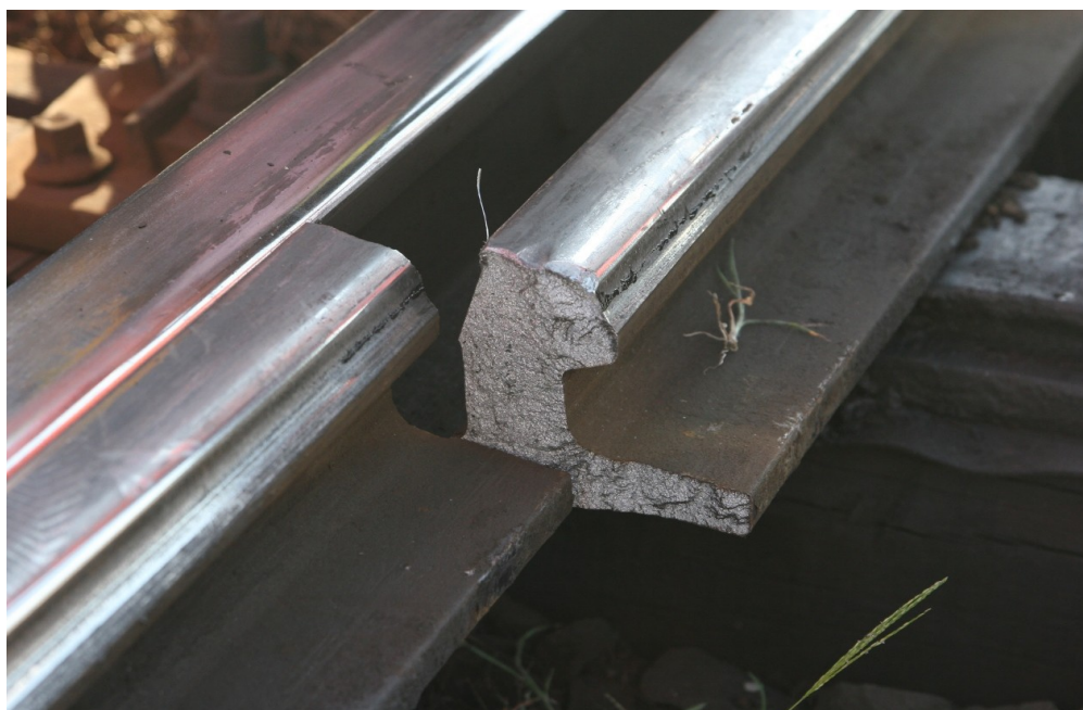
Obr. č. 4: Lom jazyka výhybky č. 75