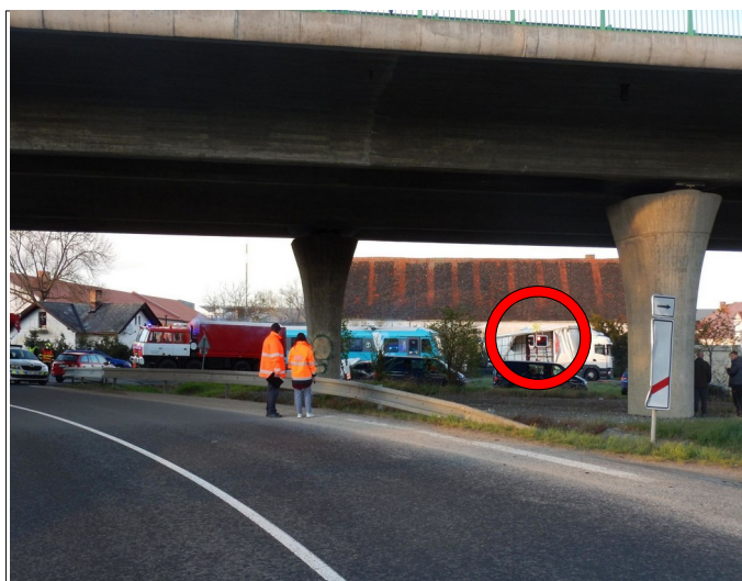
Obr. č. 3: Viditelnost výstražného kříže z 80 m