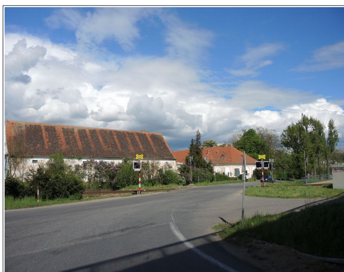
Obr. č. 5: Viditelnost výstrahy PZZ ve směru jízdy NA