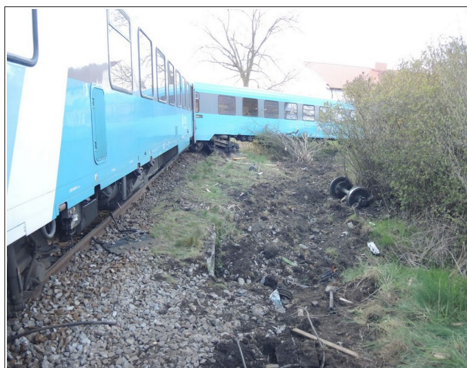
Obr. č. 7: Pohled na vlak R 1171 po MU