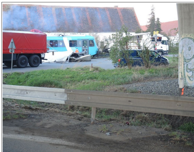
Obr. č. 4: Viditelnost výstražného kříže z 54 m