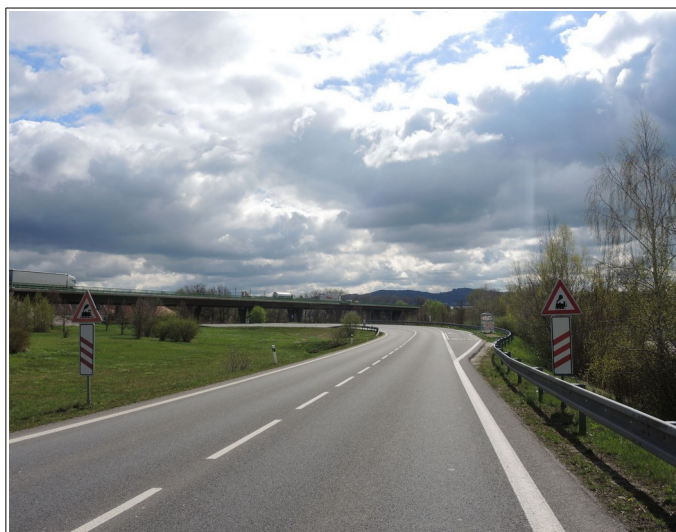
Obr. č. 2: Dopravní značení ve směru jízdy NA