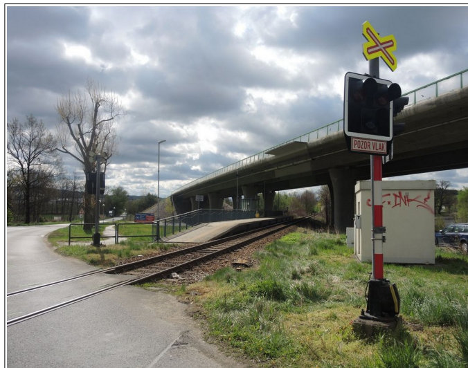
Obr. č. 6: Rozhledová délka ve směru jízdy NA a vlaku R 1171