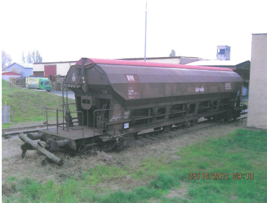
Obr. č. 1: Pohled na místo MU