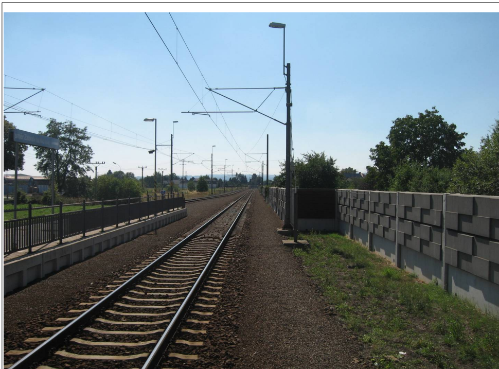
Obr. č. 2: Pohled z konce nástupiště žst. Postřelmov

postavena vlaková cesta pro protijedoucí vlak Os 3714 na SK č. 2 a hlavní (odjezdové) návěstidlo S1 červeným světlem nadále návěstilo návěst „Stůj“, byly doprovodem vlaku R 1234 zahájeny postupy před odjezdem vlaku. Osoba řídící DV (dále jen strojvedoucí) následně vlak nedovoleně uvedla do pohybu. Strojvedoucí návěst „Stůj“ návěstěnou hlavním (odjezdovým) návěstidlem S1 zaregistroval krátce před úrovní tohoto návěstidla. I přes okamžitou reakci strojvedoucího, který ihned zavedl rychločinné brzdění, vlak R 1234 před hlavním (odjezdovým) návěstidlem S1 žst. Postřelmov nezastavil. Pokračoval v další jízdě, kde násilně přestavil výhybku č. 1 a projel přes ŽP P 6655. Vlak zastavil na zábřežském záhlaví žst. Postřelmov. Nedovoleným vjetím vlaku R 1234 do postavené jízdni (vlakové) cesty vlaku Os 3714 bylo ovlivněno SZZ žst. Postřelmov, což mělo mj. za následek změnu návěstního znaku hlavního (vjezdového) návěstidla L na návěst „Stůj“. Protijedoucí vlak Os 3714 byl posléze zastaven nouzově příkazem „GENERÁLNÍ STOP“, prostřednictvím ZRDS, vyslaným traťovým výpravčím z řídicího stanoviště v žst. Šumperk. Vlak Os 3714 zastavil na trati čelem ještě před samostatnou předvěstí PFL vjezdového návěstidla žst. Postřelmov.