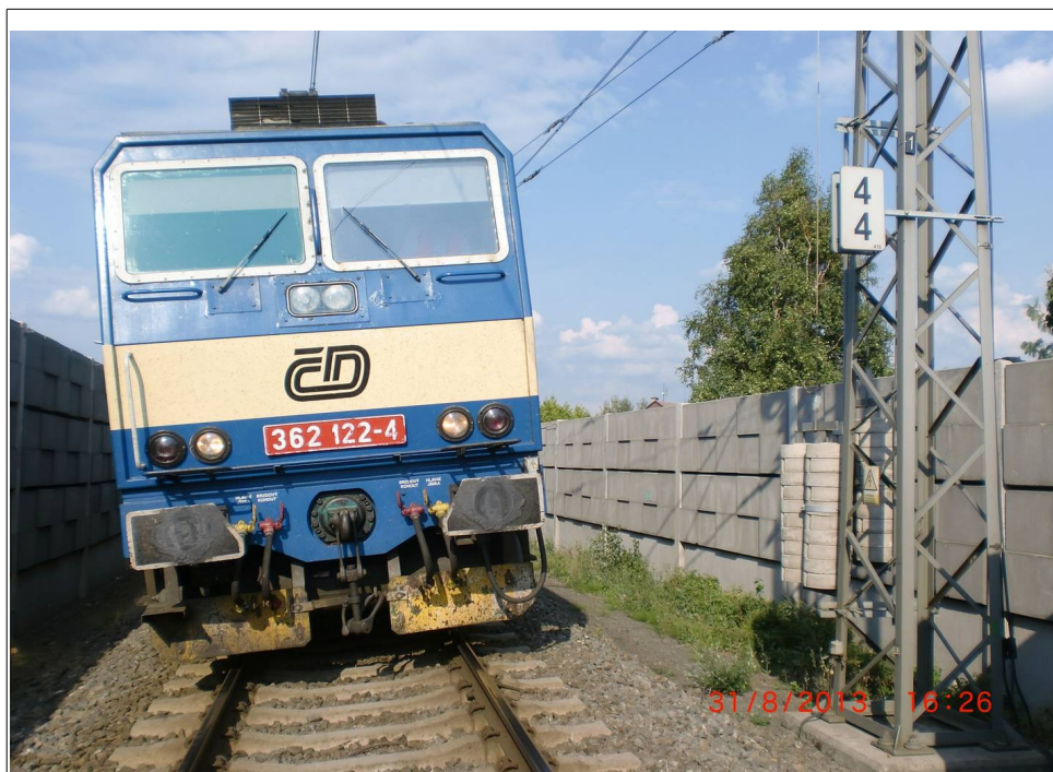
Obr. č. 3: Pohled na čelo vlaku R 1234 po zastavení po vzniku MU v km 4,400