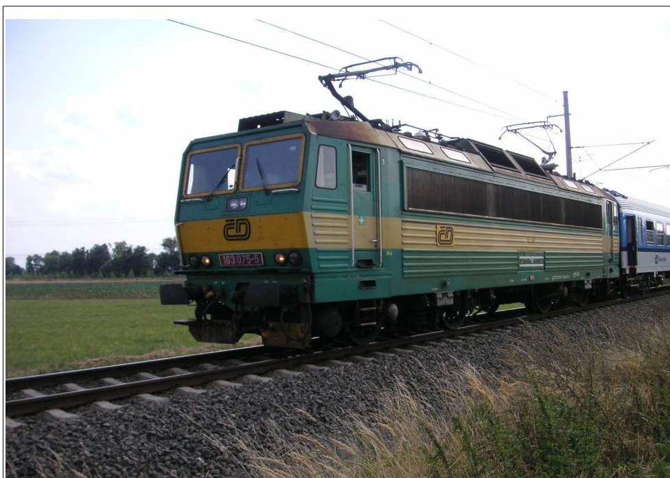
Obr. č. 4: Pohled na čelo vlaku Os 3714 po nouzovém zastavení příkazem „GENERÁLNÍ STOP“ v km 3,318