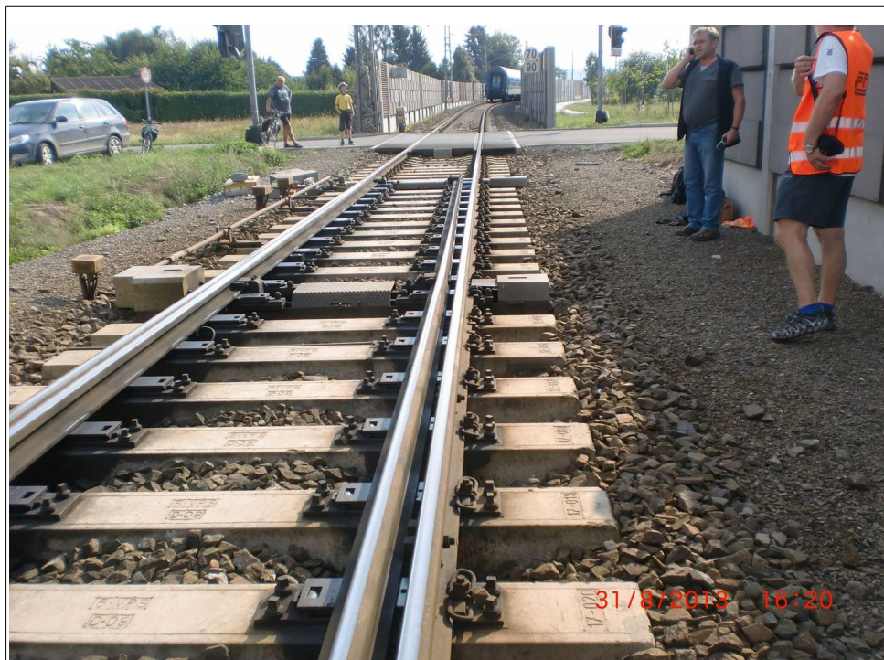
Obr. č. 5: Pohled přes výhybku č. 1 žst. Postřelmov a ŽP P 6655, v km 4,569, na konec vlaku R 1234