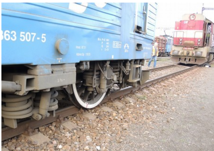
Obr. č. 1: Pohled na místo MU