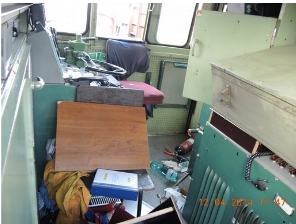
Obr. č. 6: Demolované stanoviště HDV ř. 742