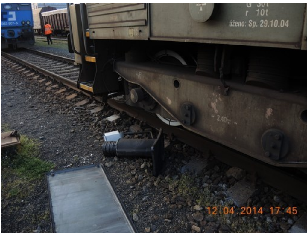
Obr. č.4: Detail poškození nárazníku