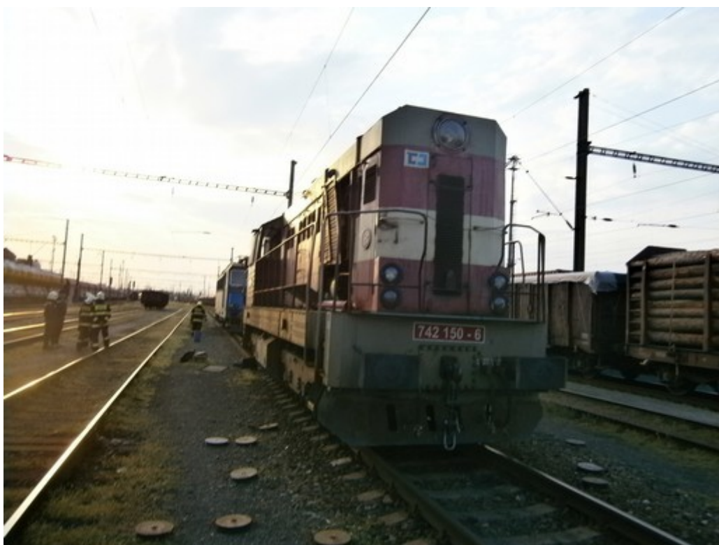
Obr. č. 5: Vypadané prvky druhotného vypružení podvozku