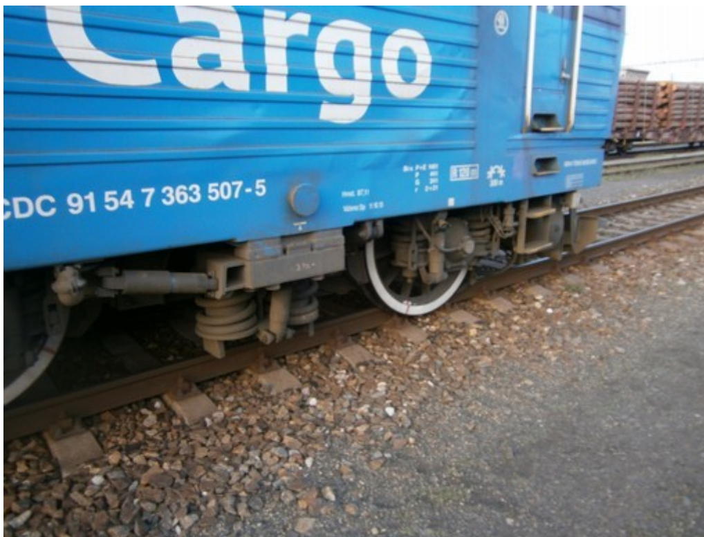
Obr. č. 3: Vykolejená náprava HDV