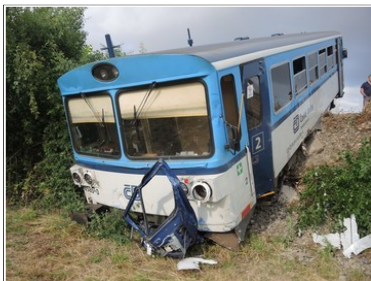
Obr. č. 5: Pohled na čelo HDV po MU