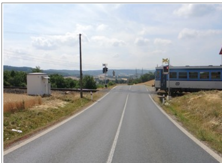
Obr. č. 9: Ověření doby výstrahy (přibližovací doby) při jízdě vlaku Os 17712

Dražní inspekce provedla ověření doby dávání výstrahy červenými přerušovanými světly spojené se zvukovou výstrahou PZZ ŽP P1735 uživatelům pozemní komunikace, tj. přibližovací doby, jízdou vlaku ve směru od dopravny D3 Lubná. Měřením bylo zjištěno, že až do okamžiku, kdy HDV vlaku Os 17712 dosáhlo úrovně ŽP (viz obr. č. 9), trvala výstraha 48 s.