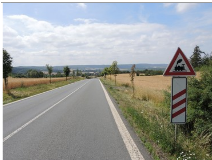
Obr. č. 3: Silniční značení ve směru jízdy dodávky