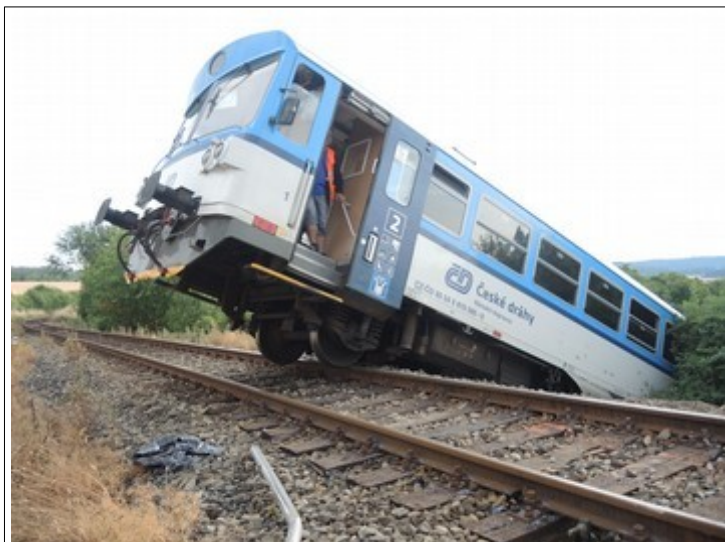
Obr. č. 4: Pohled na zadní podvozek HDV