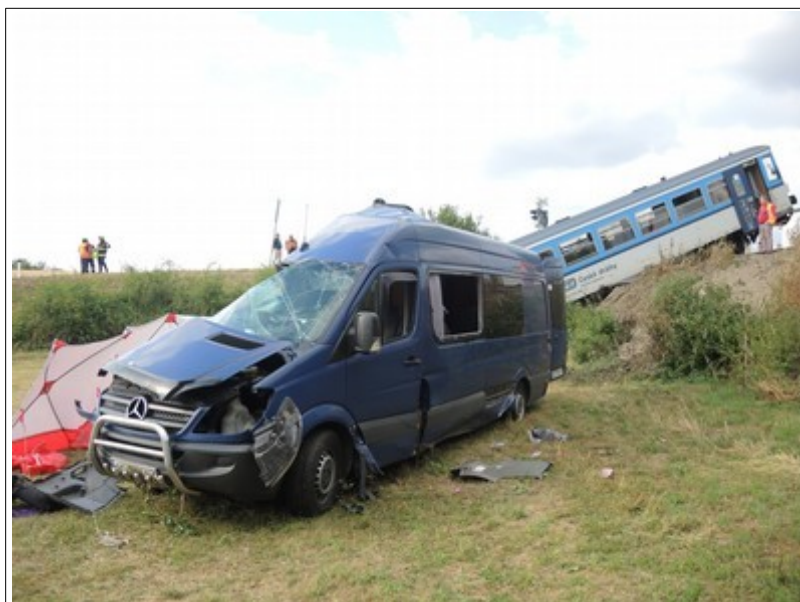
Obr. č. 1: Pohled na místo MU