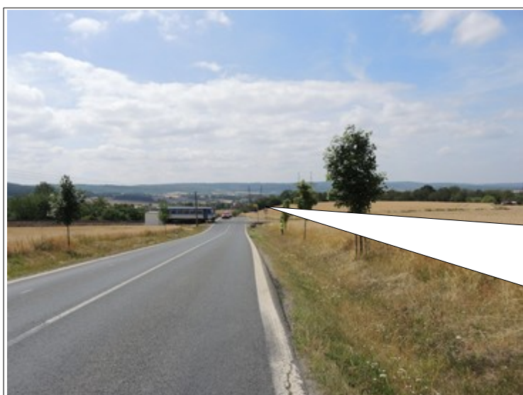
Obr. č. 6: Viditelnost výstrahy ze vzdálenosti 80 m

Výsledkem bylo naměření totožných vzdáleností viditelnosti jako v době ohledání místa MU po jejím vzniku dne 13. 7. 2019. Viditelnost výstražného kříže a světelné výstrahy na světelné skříní výstražníku byla rovněž zadokumentovaná jak ze vzdálenosti 80 m (viz obr. č. 6), tak i ze vzdálenosti 40 m (viz obr. č. 7), která je pro pozemní komunikaci II. tř. stanovena normou ČSN 74 3680 jako minimální. Z této vzdálenosti byla výstraha PZZ spolehlivě rozpoznatelná.