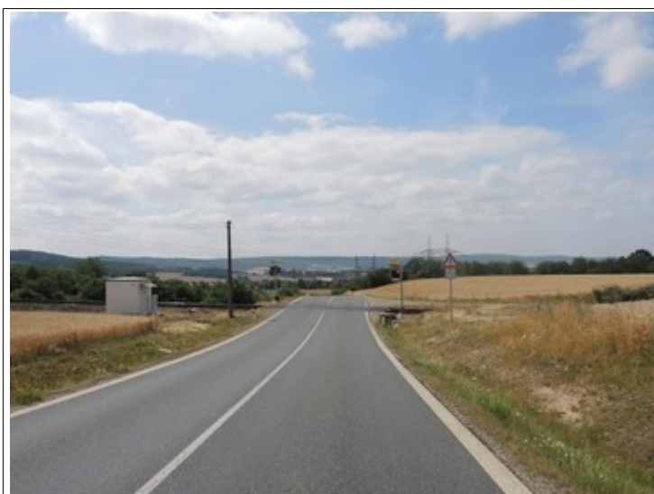
Obr. č. 7: Viditelnost výstrahy ze vzdálenosti 40 m