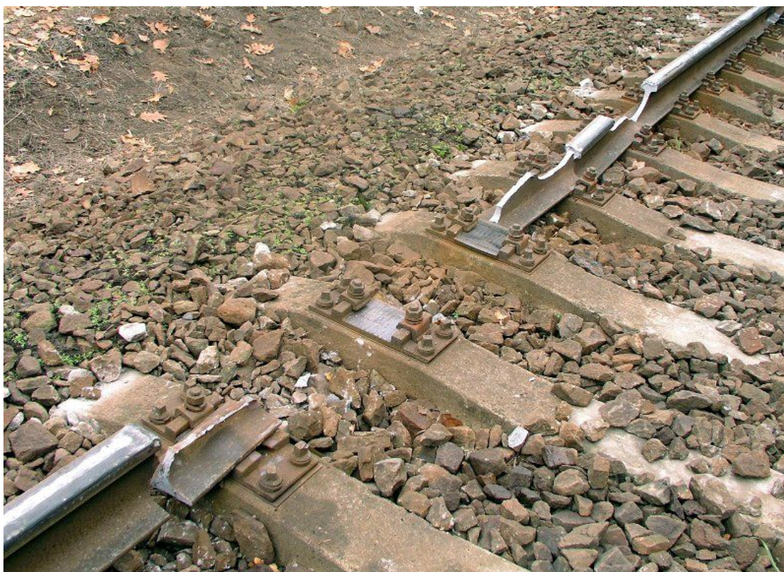
Obr. č. 1: Pohled na místo MU ve směru jízdy vl. Os 6256

K mimořádné události došlo dne 17. 11. 2011 ve 22:48 h na dráze železniční, celostátní, jednokolejné trati Pardubice hl. n. – Jaroměř, mezi žst. Pardubice-Rosice nad Labem a žst. Stéblová, km 4,250.