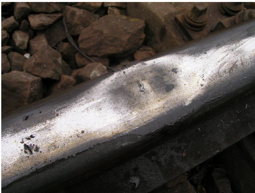
Foto 3: ukázka stavu vad na hlavě kolejnice v místech vzniku MU – tmavá skvrna, uprostřed vady je viditelná trhlina, na boku převalky