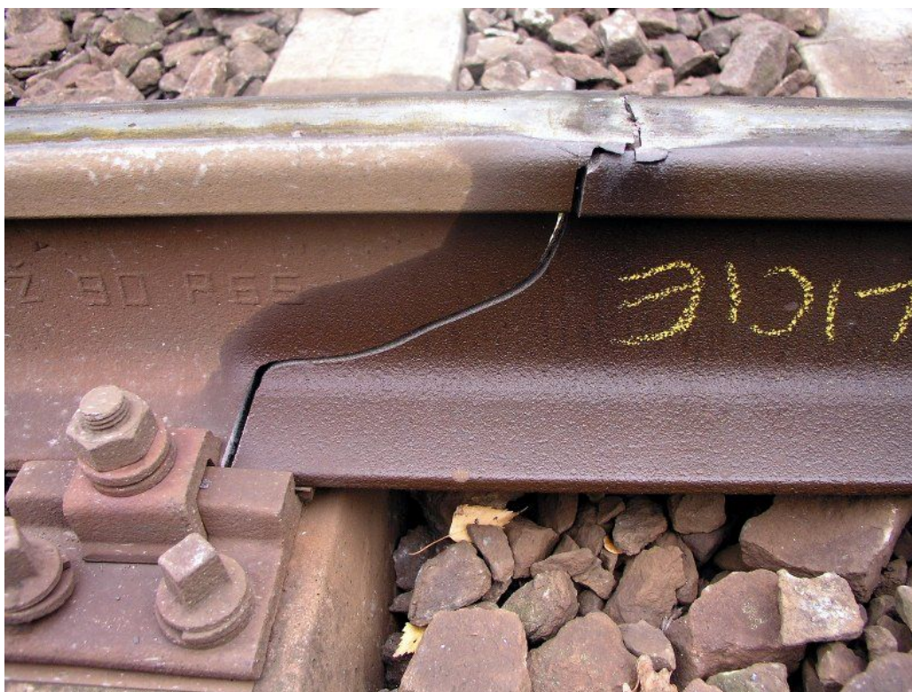
Foto 1: z místa MU - ukázka lomu kolejnice iniciovaného z defektoskopické vady v km 4,247