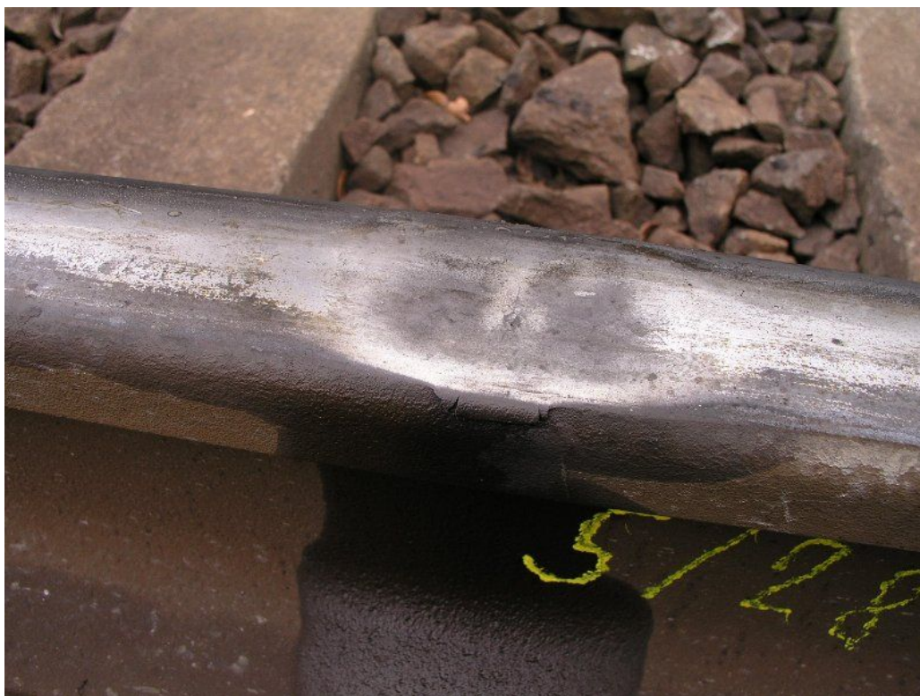
Foto 2: ukázka stavu vad na hlavě kolejnice v místech vzniku MU – tmavá skvrna, uprostřed vady je viditelná trhlina, na boku převalky