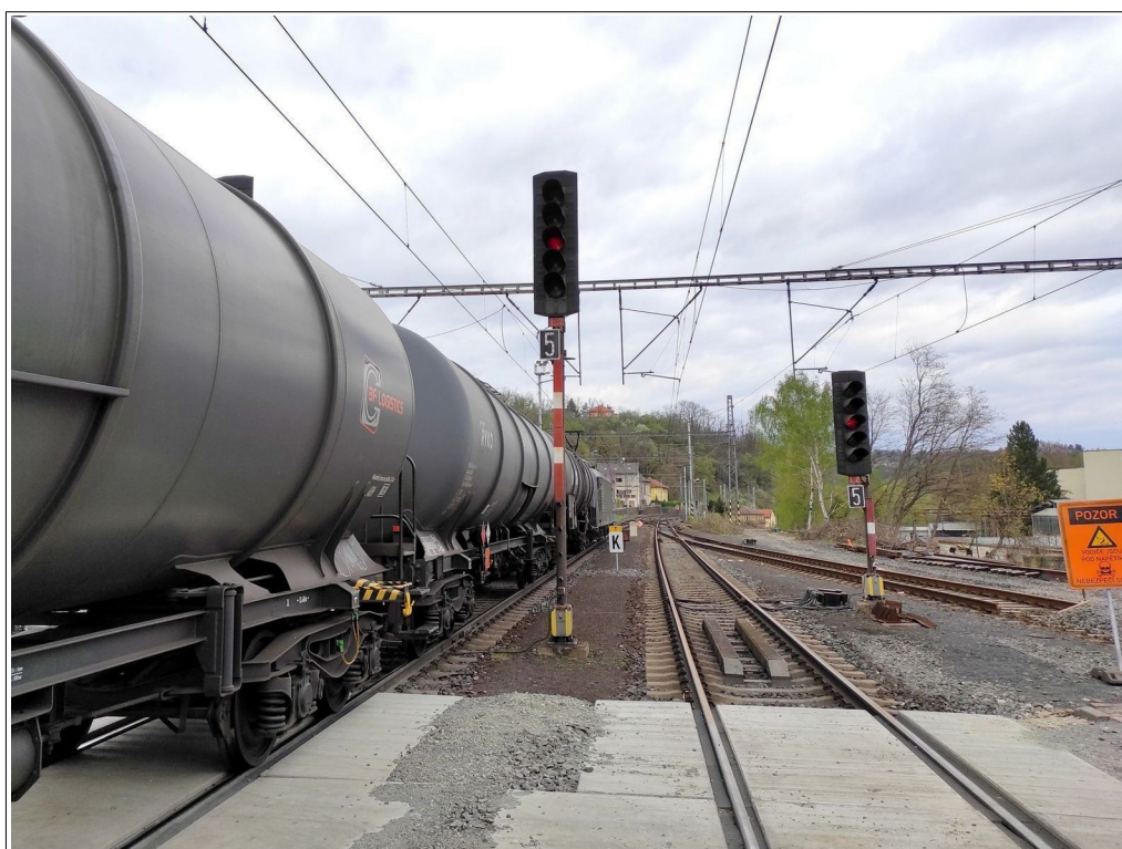
Obr. č. 4: Odjezdové návěstidlo L1 a vlak Nex 47342