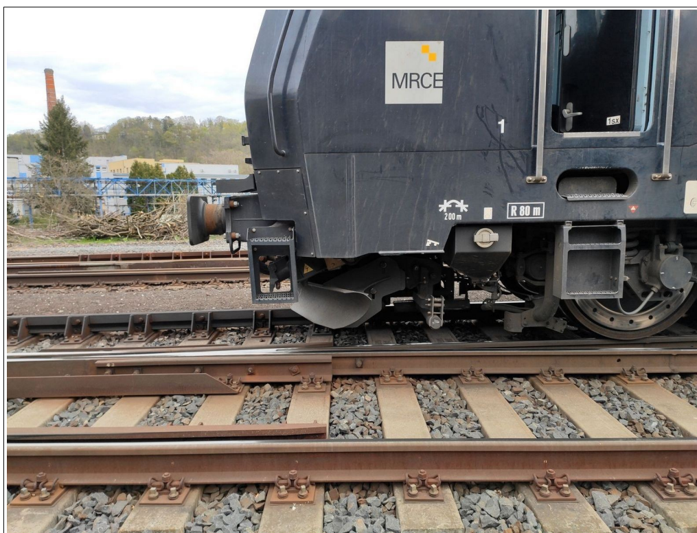
Obr. č. 3: Konečné postavení vlaku Nex 47342 v prostoru výhybky č. 11