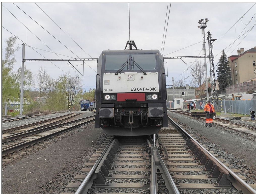
Obr. č. 2: Konečné postavení vlaku Nex 47342 v prostoru výhybky č. 11