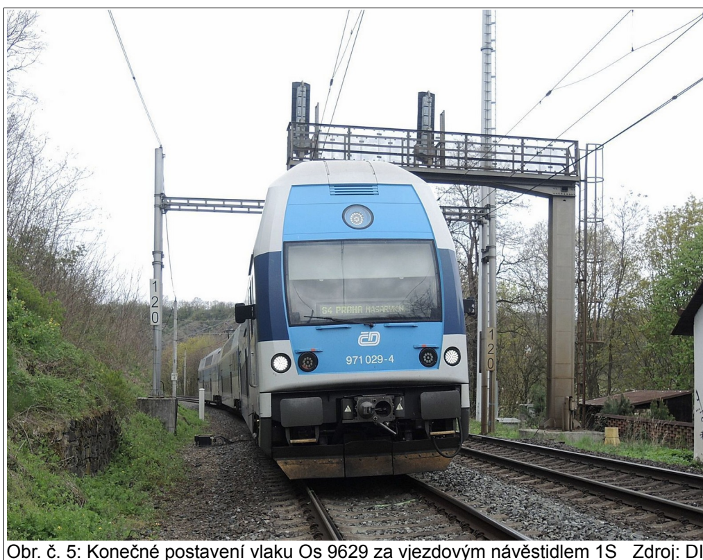
Obr. č. 5: Konečné postavení vlaku Os 9629 za vjezdovým návěstidlem 1S