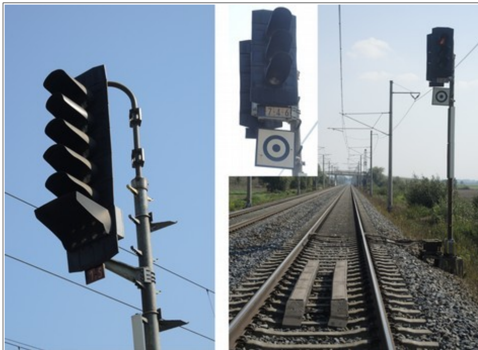
Obr. č. 3: Pohled na vjezdové návěstidlo 1S žst. Štěpánov a oddílové návěstidlo AB 1-746.