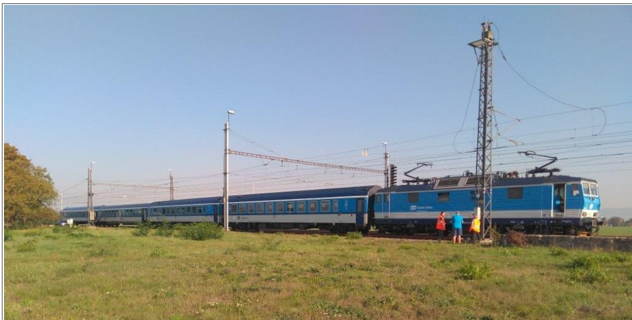
Obr. č. 1: Celkový pohled na vlak R 883 stojící v žst. Štěpánov.