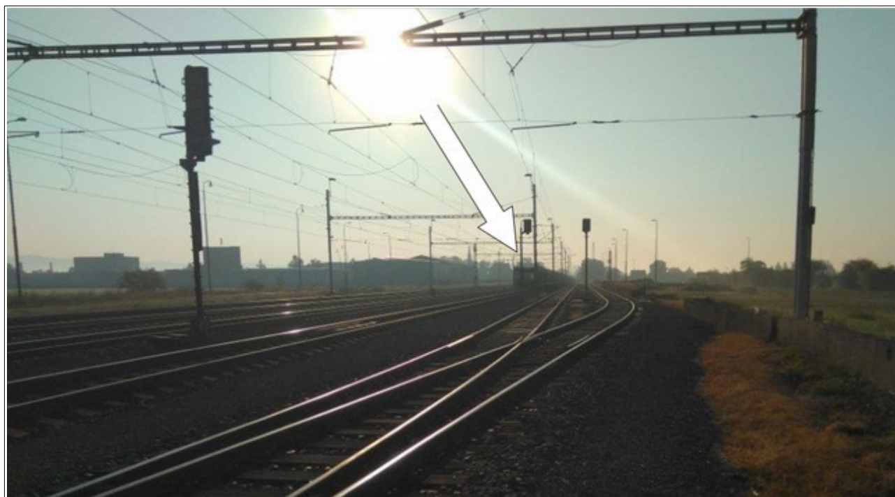
Obr. č. 4: Pohled od předního čela vlaku R 883 na konec vlaku Pn 57039 stojícího na SK č. 3 žst. Štěpánov.