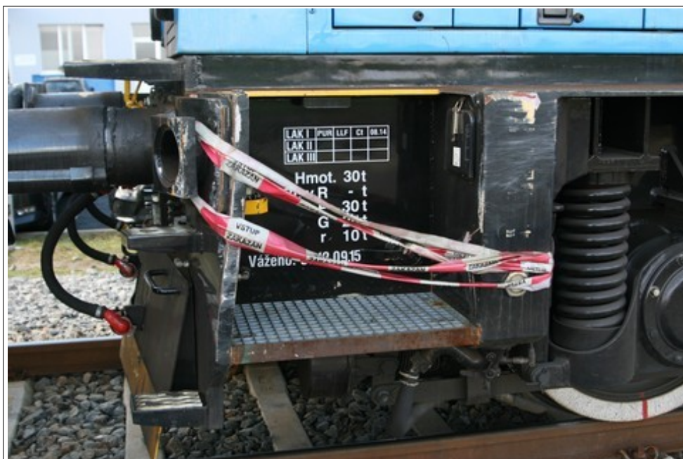
Obr. č. 1: Detail poškozeného čelníku na straně dlouhého představku a levé stupačky (schůdku) HDV CZ-VUZ 98 54 4 794 001-8 .