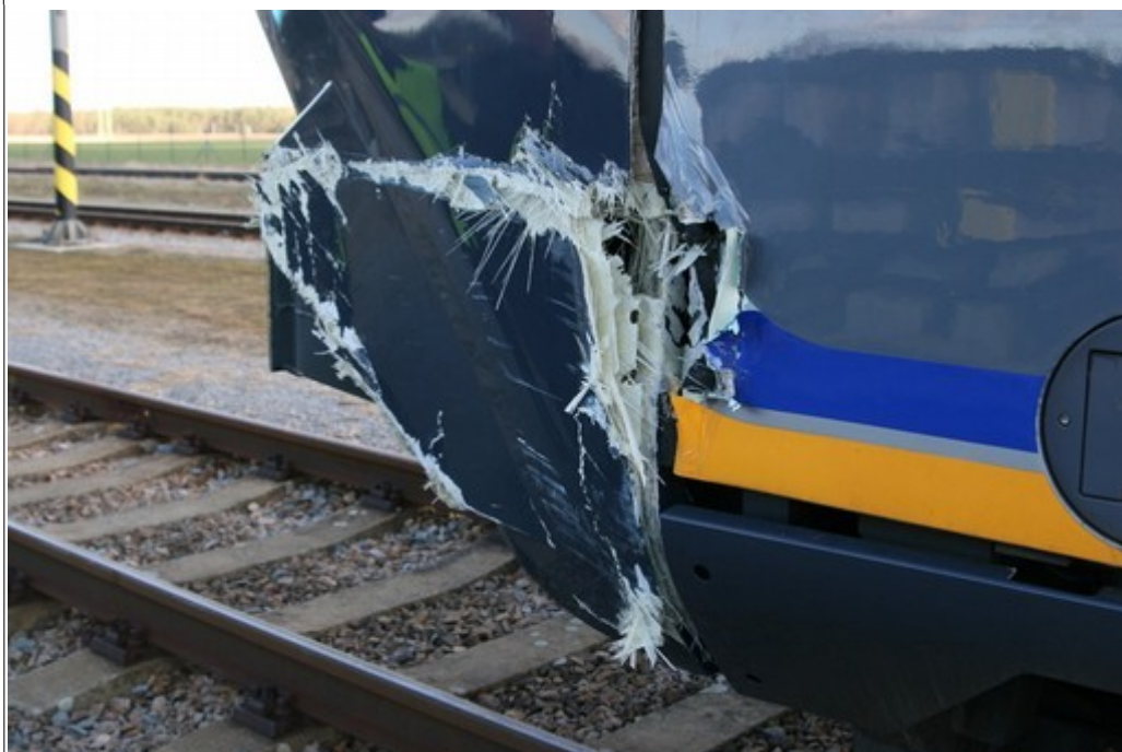
Obr. č. 4, 5: Detaily poškození vozové skříně hlavového DV „DM2“ elektrické jednotky ETR521.