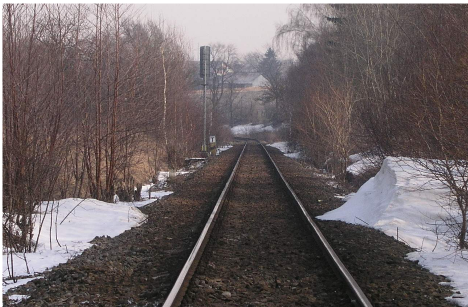
Foto 2: Místo srážky a vykojení, stav k 23. 2. 2011