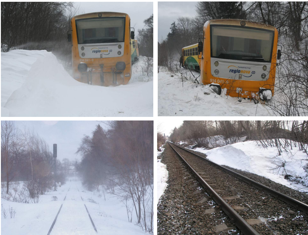
Obr. č. 1: Pohled na místo srážky a vykolejení

Ke vzniku MU došlo dne 6. 1. 2011 v 11:05 hod. na dráze železniční, kategorie celostátní, trati Havlíčkův Brod – Pardubice/Rosice nad Labem, v km 45,823 mezi zastávkou Vojtěchov a Holetín, poblíž hradla Raná.