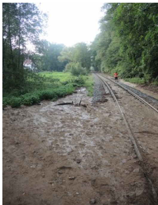
Obr. č. 5: Naplavené bahno proti směru jízdy Os 18110 Zdroj: DI