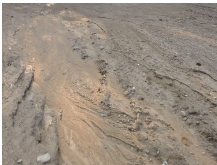
Obr. č. 12: Stopy po tekoucí vodě

Tekoucí srážková voda vytvořila na poli viditelné stopy – koryto (viz obr. č. 12).