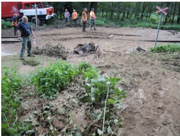
Obr. č. 6: Naplavení větví a kořenů stromů na ŽP