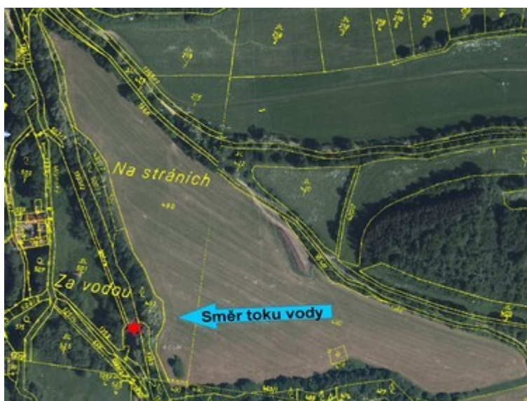
Obr. č. 11: Pohled na směr tekoucí srážkové vody

Pole ve své spodní části navazuje na svah přilehlý k železniční trati v prostoru ŽP P964 vlevo ve směru jízdy vlaku Os 18110 v nadmořské výšce 464 m n. m. Horní část pole se nachází v nadmořské výšce 504 m n. m. Převýšení mezi spodní a horní částí pole na jeho délce 380 m je 40 m.