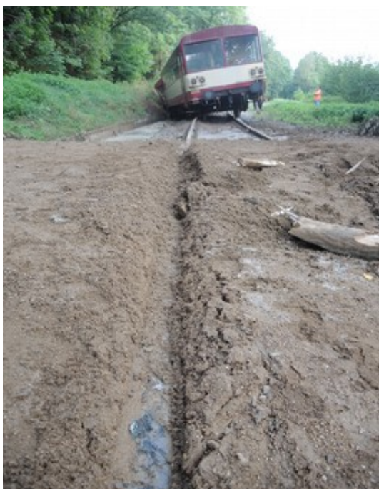
Obr. č. 4: Vrstva zeminy na kolejnicových páslech