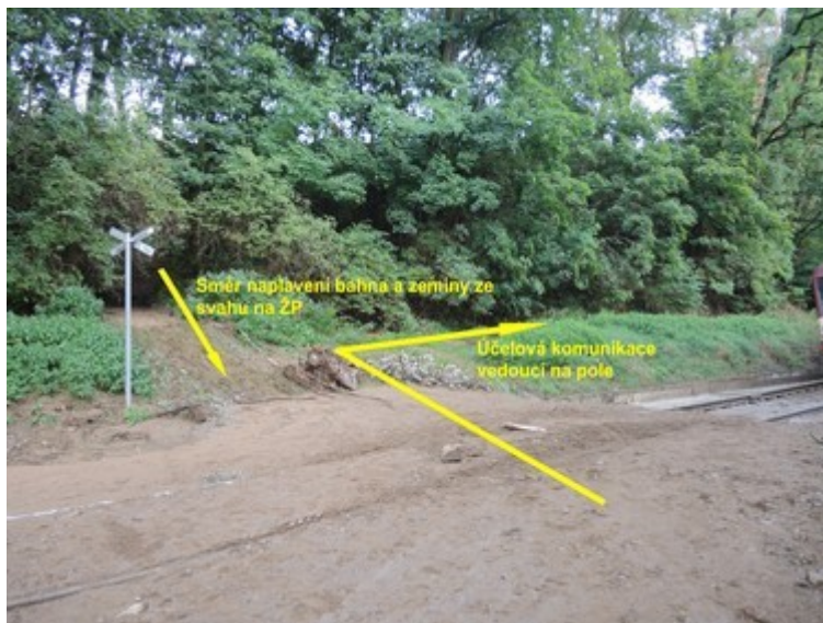
Obr. č. 13: Pohled na prostor ŽP