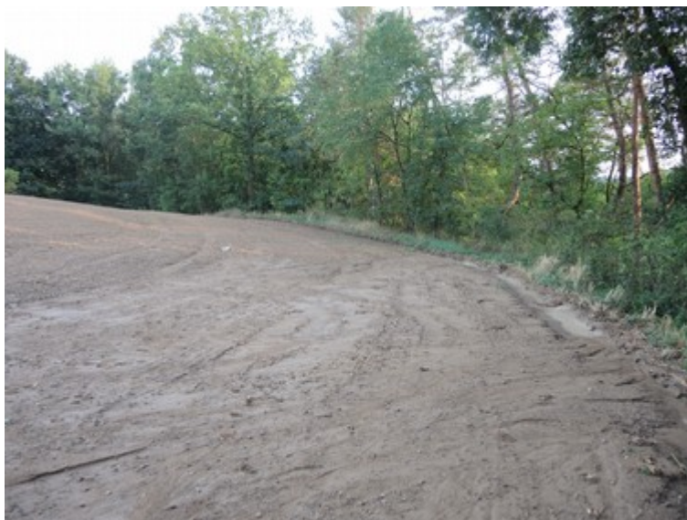
Obr. č. 8: Stopy po stékající vodě z pole na svah