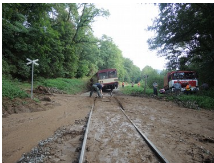
Obr. č. 3: Pohled na prostor ŽP P964