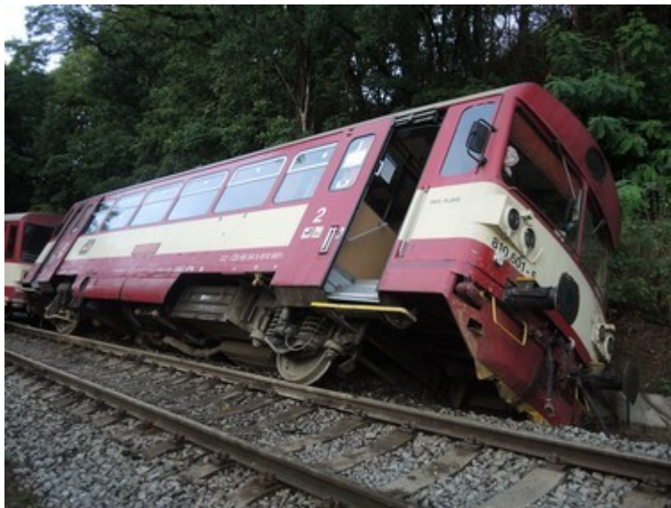
Obr. č. 9: Vykolejené a nakloněné HDV