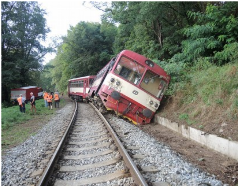
Obr. č. 1: Pohled na místo MU

GPS: 49°09'26.26778" N, 13°54'12.58988" E.