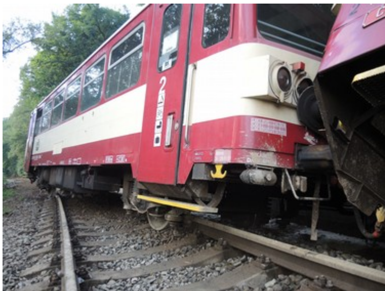
Obr. č. 10: Vykolejené TDV