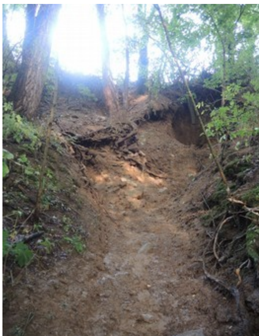
Obr. č. 7: Vytvoření koryta ve svahu vyplavením zeminy