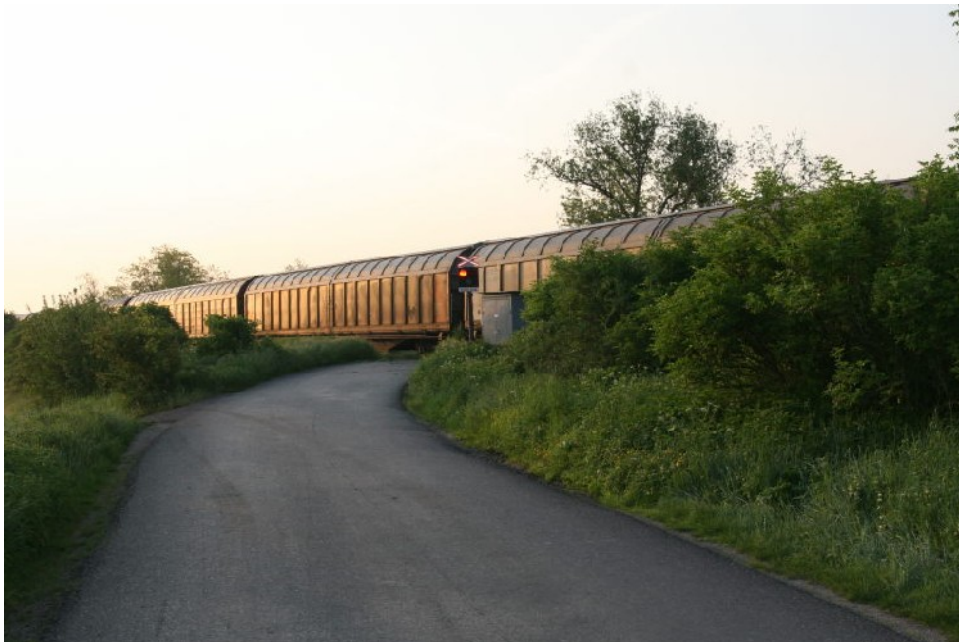
Foto 7.11: Pohled na PZZ železničního přejezdu ze směru příjezdu NA s přívěsem.