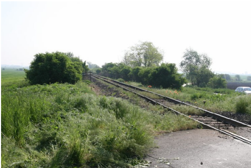
Foto 7.12: Železniční trať ze směru příjezdu vlaku z pohledu řidiče NA.