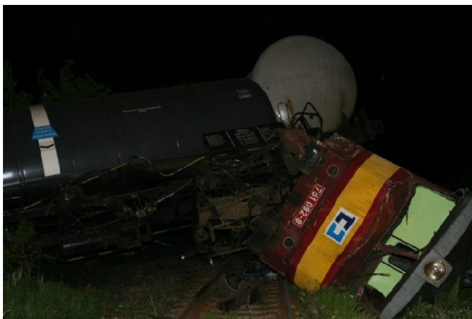
Foto 7.3: Vykolejené HDV 751.092-8 a první dvě tažená DV bezprostředně po vzniku MU z protisměru jízdy vlaku.