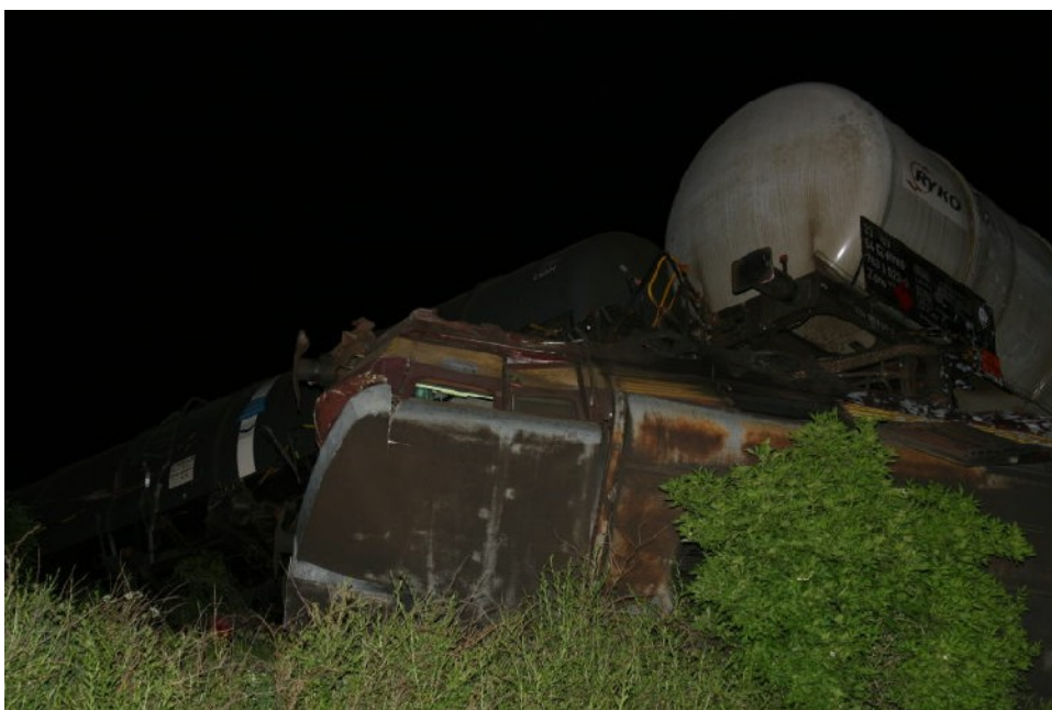
Foto 7.4: Vykolejené vlakové HDV 751.092-8 a první dvě tažená DV bezprostředně po vzniku MU z levé strany ve směru jízdy vlaku.