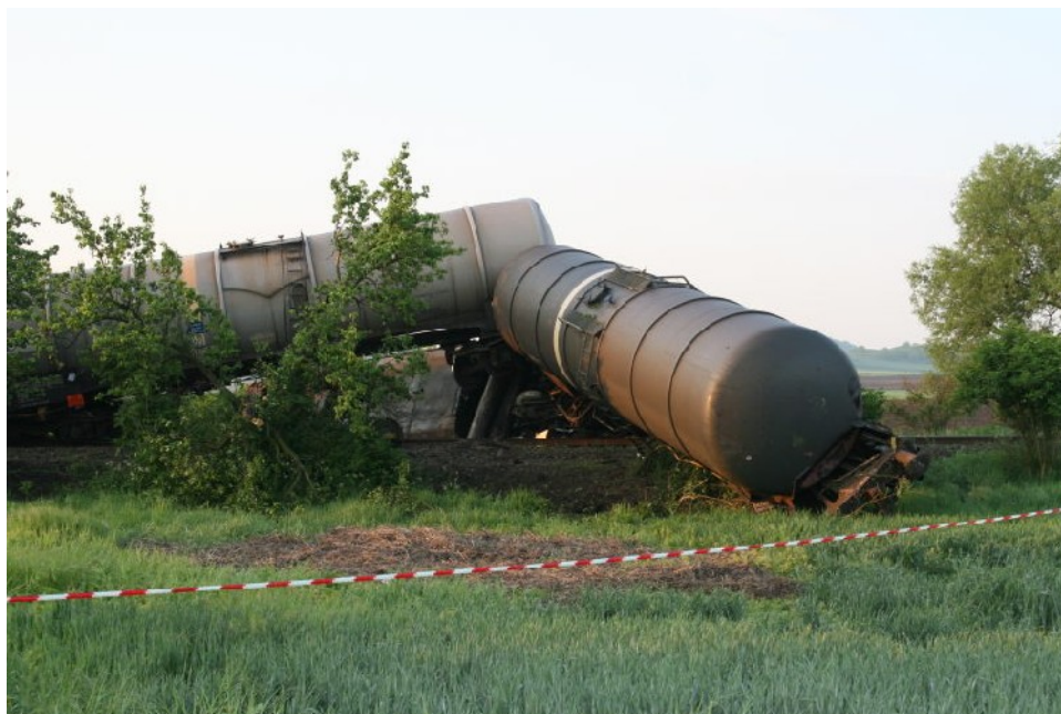
Foto 7.5: Vykolejené HDV 751.092-8 a první dvě tažená DV z pravé strany ve směru jízdy vlaku.