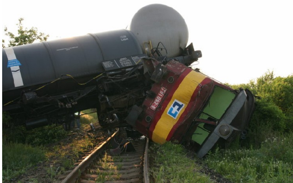
Foto 7.10: Vykolejené HDV a první dvě tažená DV z protisměru jízdy vlaku.