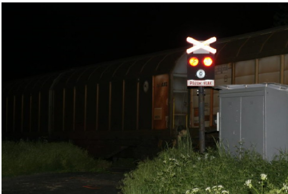
Foto 7.2: Výstražný signál PZZ kategorie PZS 3 SBI bezprostředně po vzniku MU ze směru jízdy NA s přívěsem.