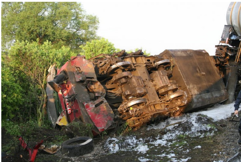
Foto 7.9: Vykolejené HDV 751.092-8 (zleva ve směru jízdy vlaku).