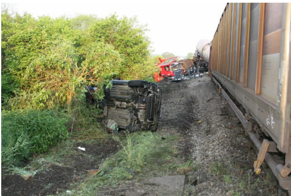
Foto 7.7: NA a jím převážený OA z levé strany ve směru jízdy vlaku.